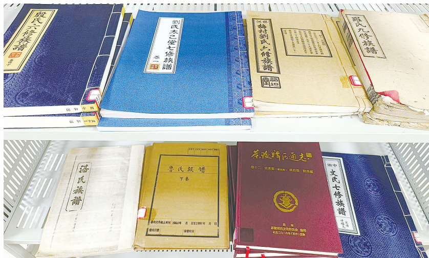
市档案馆收藏的部分族谱档案。

世孙由江西丰城罗田迁徙至攸北天都苦竹院(今攸县皇图岭),晚岭朱氏,元末由江西坡山迁徙至醴陵北部,其后繁衍散落于醴陵西北城乡。再如,黄沙岭彭氏,源于南宋末年南昌令(古代官职)彭历山奉命携家眷隐居攸县沙陵渡。这些资料对研究株洲人文历史具有重要的参考意义。