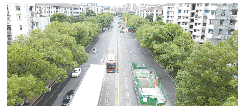
今年7月底前,长江南路上的围挡将全部撤除。

例如,今年4月下旬,雨季一过,施工队伍迅速进场,在长江南路打下一口10米深井。由于该处施工区域地下普遍为积水能力差的流沙层,不久井内开始出现涌水。由于下游管道还未拉通,井内积水只能靠水泵抽出,但效果不佳。“若不能及时堵住涌水,将严重影响整体施工进度。”上述负责人介绍。 事不宜迟,项目组决定动用“蛙人”下井。井口一米见圆,井内暗无天日,加之污水浑浊不清,三名“蛙人”轮番下井,最终耗时三个多小时成功止住涌水,为后续施工抢回了更多的