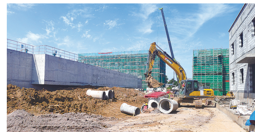
天元区群丰污水处理厂施工现场,本月底这里将完成主体建设。

时间。 比起这些背后故事,项目组更关心如期交付。目前,长江广场至泰山广场段雨污分流改造项目进度过半,预计今年7月该路段路面将全面恢复。目前,长江广场至泰山广场段雨污分流改造项目进度过半,预计今年7月该路段路面将全面恢复。