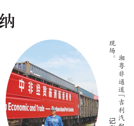
湘粤非通道“吉利汽配”班列首发现场