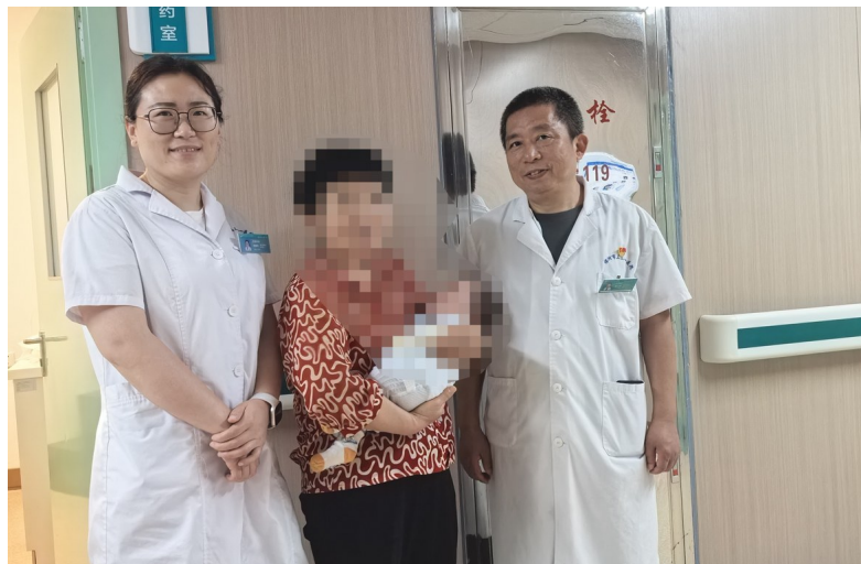
痊愈的宝宝与妈妈及医生合影。

当大多数17天大的婴儿还在父母怀里安然熟睡时,株洲市一名小宝贝却经历了一场惊心动魄的健康挑战——肛周脓肿。经过株洲市三三一医院肛肠外科的精心治疗,这位