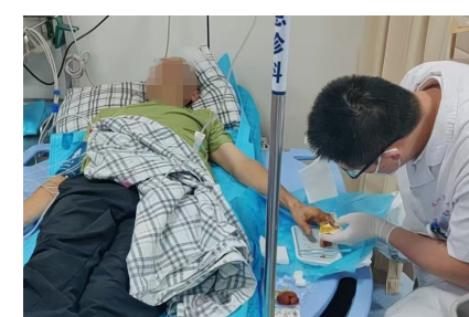
医生正在处理伤口。

如果不慎被蛇咬伤,要立即脱离蛇咬环境,勿企图去捕捉或打蛇,以免再次咬伤。尽量记住蛇头、蛇体、斑纹和颜色等特征,有条件者拍摄留存咬伤的照片。同时保持冷静,避免慌张,减少伤肢活动。去除受伤部位的各种受限物品,以免因后续的肿胀导致无法取出,加重局部损害。值得注意的是,绷带加压固定可用于神经毒类毒蛇咬伤,但要避免压迫过紧、时间过长导致肢体缺血而坏死。如果周围有清洁水源,可反复冲洗伤口。