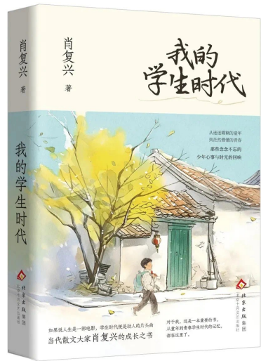
我的学生时代 作者:肖复兴 出版社:北京十月文艺出版社 出版时间:2025年03月

“学生时代,无疑是最美好的,让人对未来充满无限的憧憬和期待,仿佛明天的到来,一定会有什么新鲜的事情。”《我的学生时代》是肖复兴的最新散文集,记录了肖复兴从童年到青春学生时代经历的回响、怀旧与思考,是少年心事与时光的回响。