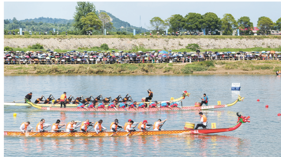
2025株洲·绿江龙舟邀请赛比赛现场。

株洲日报讯(全媒体记者/邹怡敏 通讯员/傅博芸 刘艺峰) 6月5日下午,2025株洲·绿江龙舟邀请赛如约在绿江绿口水电站段上游水域举行,来自绿口区乡镇和区直机关的14支龙舟队伍展开水上角逐。 尽管当天是工作日且天气炎热,前来观赛的群众还是把两岸围得层层叠叠,大家笑容满面,举着手机、相机或拍视频或进行直播,期待着“速度与激情”的对决。 下午3时,发令号一响,队员们挥桨逆流而上,奋力向着500米赛道的终点进发。