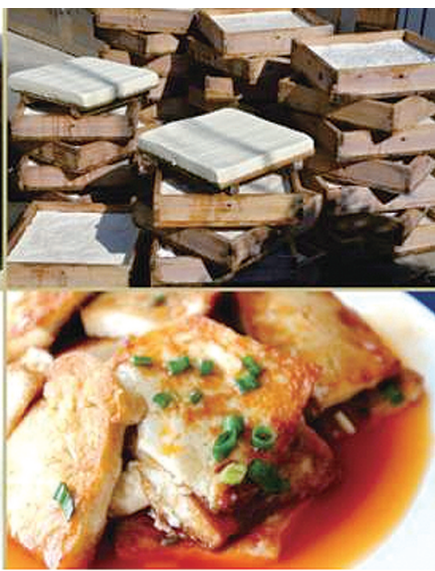
攸县豆腐。

做豆腐剩下的豆渣也可以“霉”。东乡的做法是将豆渣和上一些米粉,做成拳头大小的纺锤形,发霉后烤干。食用时切片,与黄豆、虾米辣椒一起炒,能出肉味来,是为豆渣饼。西南的溇田一带,则将豆渣团成小球,待来霉后做汤吃,也别有滋味。