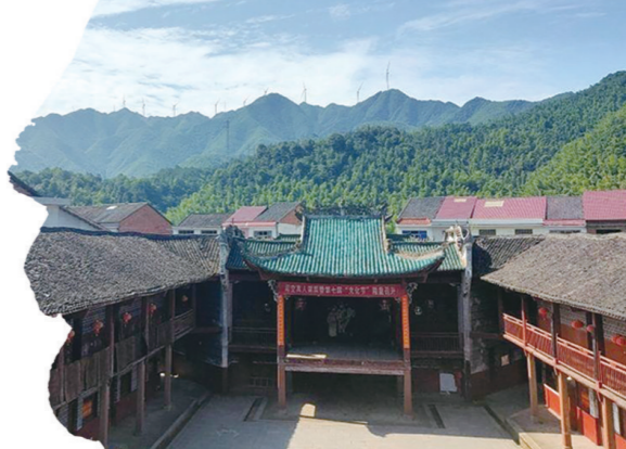
掩映在群山之间的阳升观

暮色四合，回首望阳升观，已隐入大山的苍茫。山径上扫叶声复起，沙沙，沙沙，如仙人低语。忽记起观中残碑刻着一句：大道无形，唯此心能容天地；红尘万丈，偏此处可觅蓬莱。