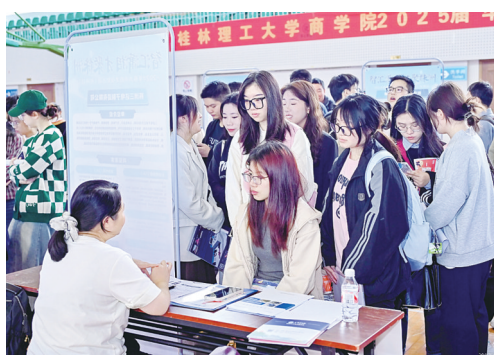
市人社局组织企业走进桂林高校招才。(资料图)

启动了促进高校毕业生“留湘来湘”系列行动,提出聚焦优秀青年人才群体,通过多渠道拓岗、多层次招聘、多角度引才、多方式服务、全方位宣传,吸引更多省外优秀青年学子来湘就业创业。此次活动是芦淞区人社部门落实高校毕业生“留湘来湘”工作的举措之一。接下来,市人社局将组织“智汇潇湘·才聚株洲”行动走进更多高校招才引智。