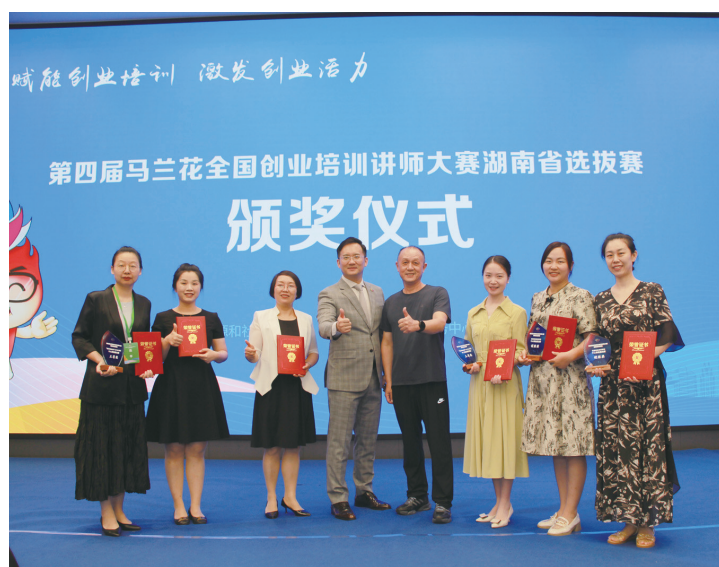
株洲创业导师参加“马兰花”选拔赛并获奖。

株洲日报(全媒体记者/何春林 通讯员/叶云程 程海亮) 5月30日,我市发布了前五个月的民生补短提质攻坚工作成绩单。截至5月26日,省重点民生实事各项任务全部达到序时进度。其中,就业创业尤为突出。