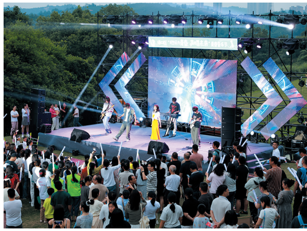
责任编辑:胡文洁 邹家虎