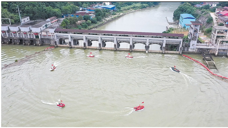
应急救援演练现场。

在5月22日,茶陵县开展的防汛抗灾暨水上应急救援综合演练中,该县气象局依托“631”