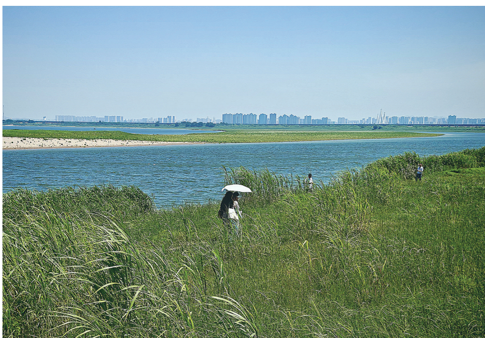
“守护好一江碧水”首倡地，“江豚的微笑、候鸟的欢歌、麋鹿的倩影”已成为岳阳的三张新名片。