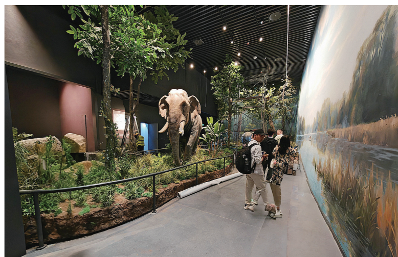
洞庭湖博物馆的天然乐园通过沉浸式复原景观展示了动植物的生存环境。