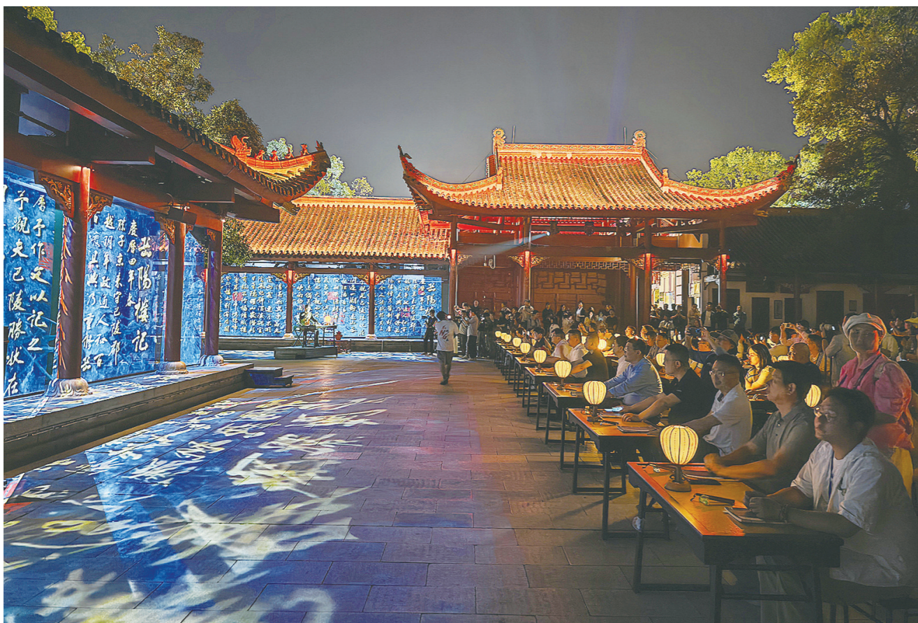
岳阳楼景区推出《今上岳阳楼》诗境剧场。