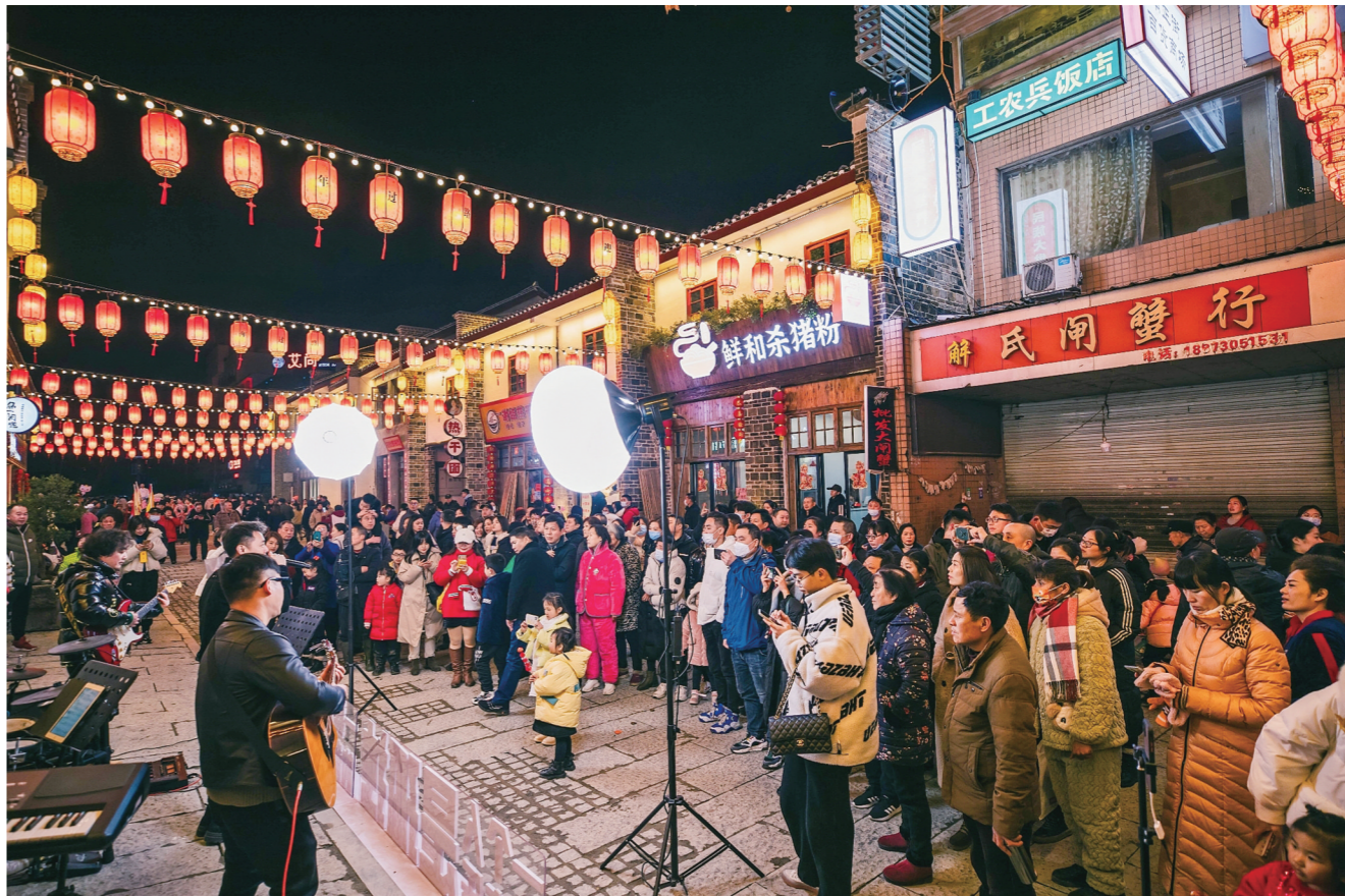
汴河街成为游客和市民的夜游网红街区。