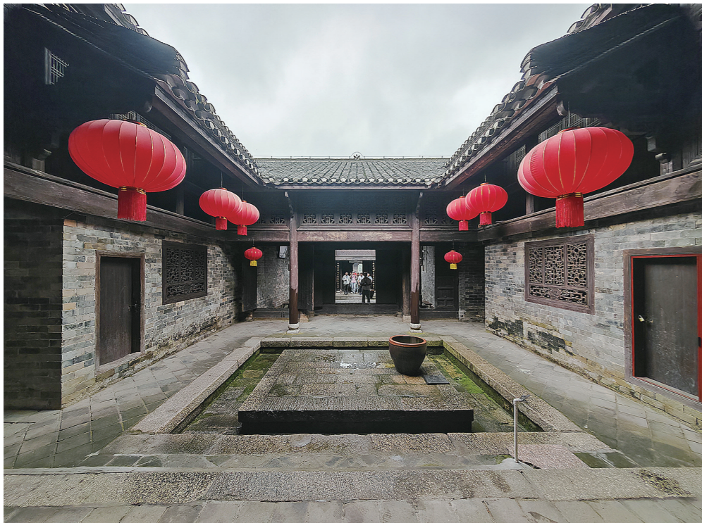
历经600余载的张谷英村。