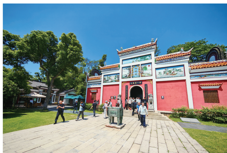
君山岛又称爱情岛，这里的湘妃祠讲述着娥皇、女英对舜帝的忠贞爱情。