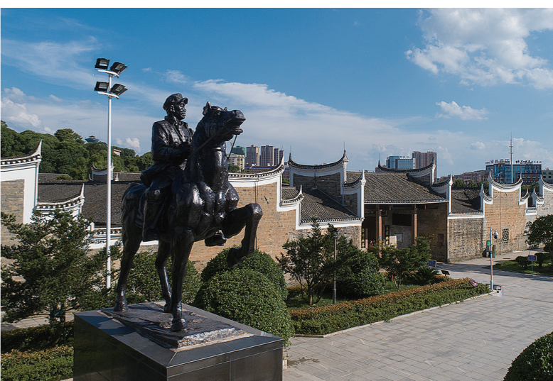
平江起义纪念馆，展陈了从这里走出的52位开国将军的奋斗故事。