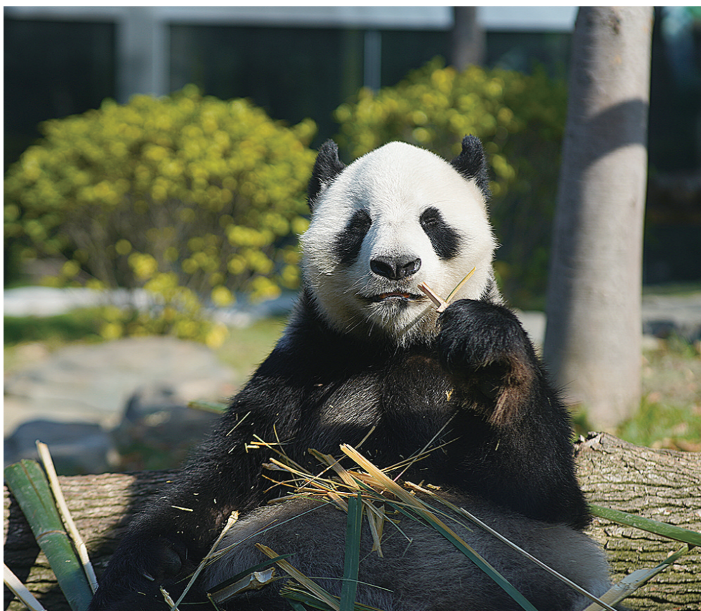
岳阳中华熊猫苑的明星国宝。