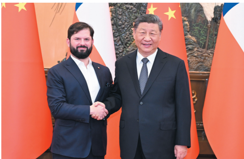
习近平会见智利总统博里奇。

新华社北京5月14日电 5月14日上午,国家主席习近平在北京人民大会堂会见来华出席中拉论坛第四届部长级会议的智利总统博里奇。