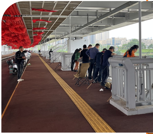
清水塘大桥景观通道垂钓者扎堆。