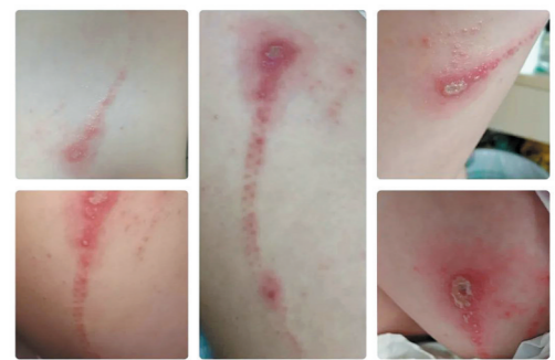
隐翅虫咬后的皮肤状态。