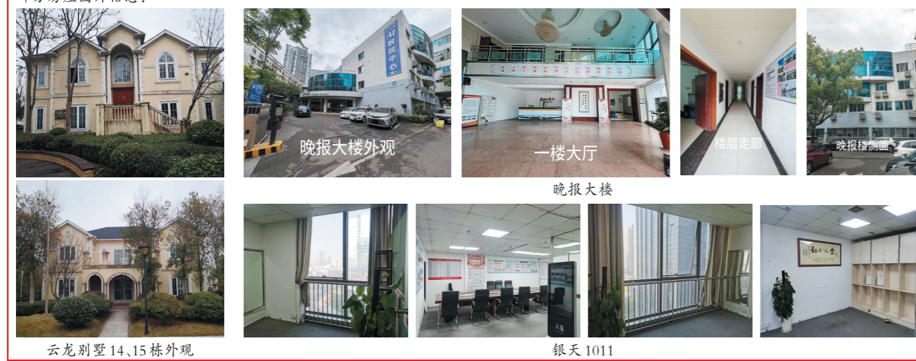
云龙别墅14、15栋外观 晚报大楼外观 一楼大厅 银天1011