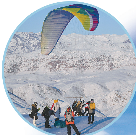
游客在新疆阿勒泰将军山国际滑雪度假区体验滑翔伞。