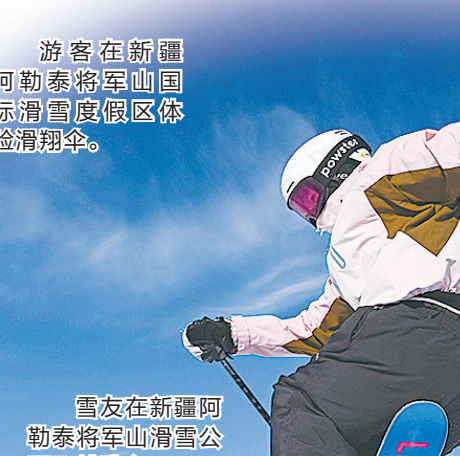
雪友在新疆阿勒泰将军山滑雪场飞跃跳台。