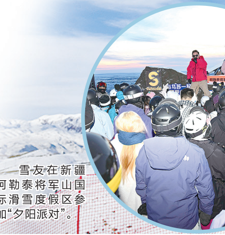
雪友在新疆阿勒泰将军山国际滑雪度假区参加“夕阳派对”。