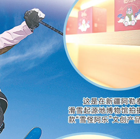
这是在新疆阿勒泰人类滑雪起源地博物馆拍摄的一款“雪怪阿乐”文创产品。