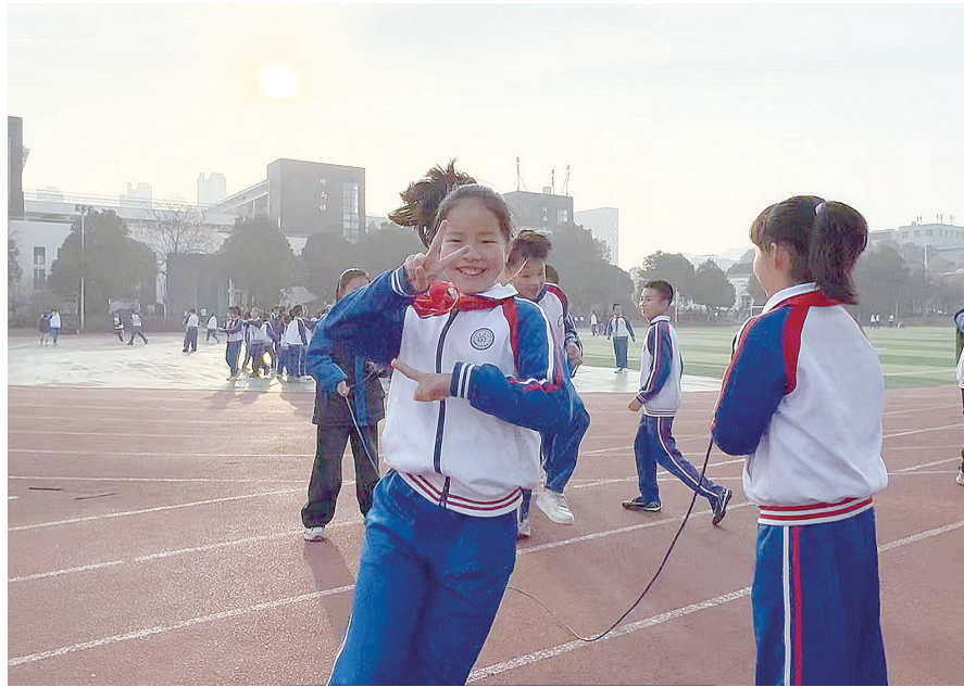
同学们在运动中开启新的一天。

眠,但没多久,孩子们都喜欢上了。”2023年春,学校开启了这场新的尝试,以三年级为探索的突破口,随后向其他年级拓展。王建军坦言,在“阻力”下,校领导坚持带队训练,慢慢地,越来越多的家长也开始接受并支持该项活动。