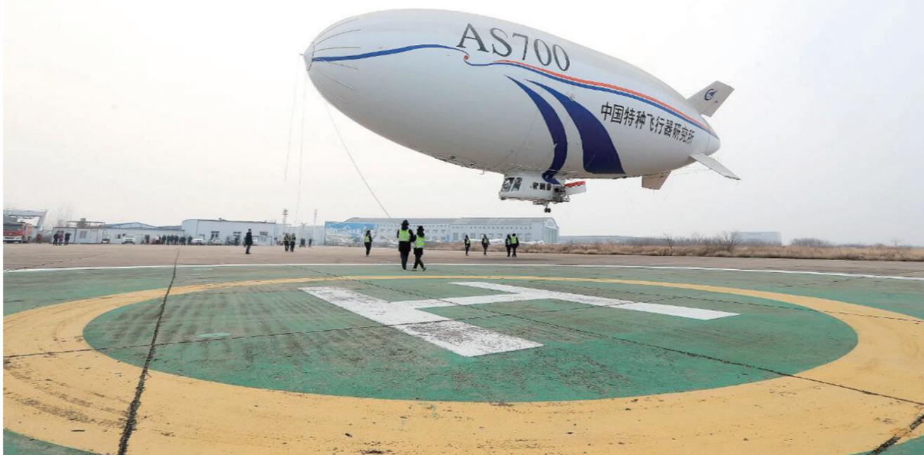
图为AS700D飞艇。

据新华社武汉2月21日电 记者从中国航空工业集团特种飞行器研究所获悉，2月21日，国产载人飞艇“祥云”AS700电动型AS700D在湖北荆门成功完成科研首飞，验证了技术成熟度和原理，为后续电动飞艇的研制及应用进行技术储备。