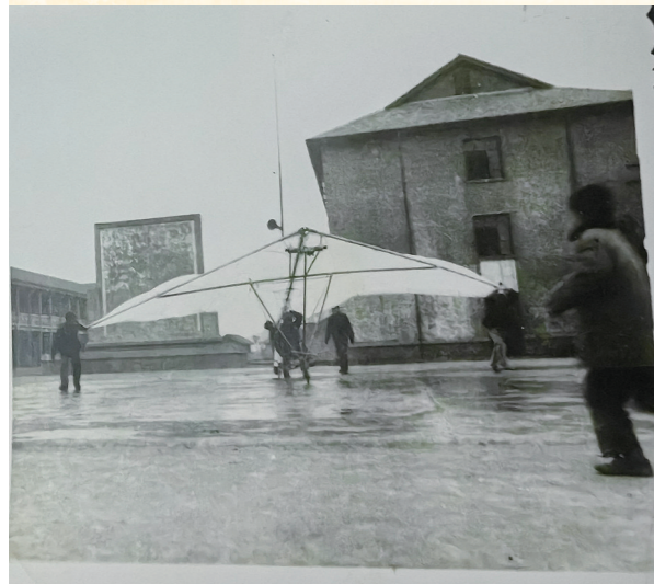
父亲和有关人员研究改进滑翔伞功能