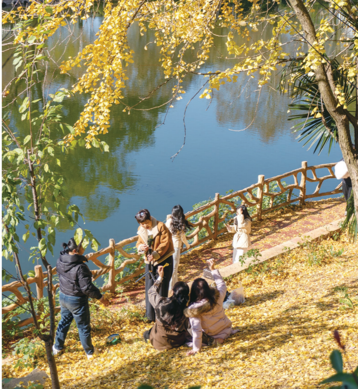
12月15日,神农公园,暖阳下的冬景五彩斑斓,吸引不少游人。