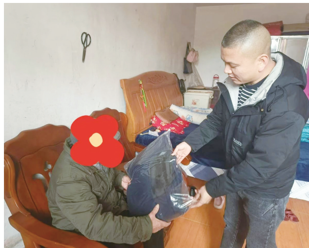
民政部门送棉衣现场。

市民政局对各城区民政部门提出明确要求,务必高度重视此次防寒棉衣发放工作,以此为契机,结合服务类社会救助需求摸排,展开“地毯式”“全覆盖”大排查,深入了解特困人员的生活状况和救助服务需求,及时排查并消除用水、用电、用火等方面的安全隐患,对符合救助条件的人员分层分类实施精准救助,坚决做到应救尽救、应帮尽帮,让每一位特困人员都能感受到党和政府的关怀与温暖。