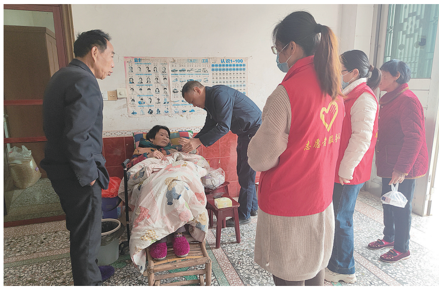
医防融合包村服务团队进村走访。通讯员供图