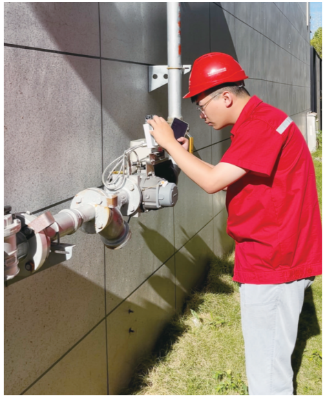
烈日下,巡检维护员在对燃气设施进行检查。

“每一次巡检,好比对燃气设施进行一次‘号脉’。”易敏称,越是高温天气,安全生产越不能放松。自今年6月份“安全生产月”活动启动以来,株洲中油燃气有限公司全体巡检维护员加大了对管网的巡查力度,坚持做到排查治理全覆盖、无盲区,坚决遏制燃气安全事故发生。