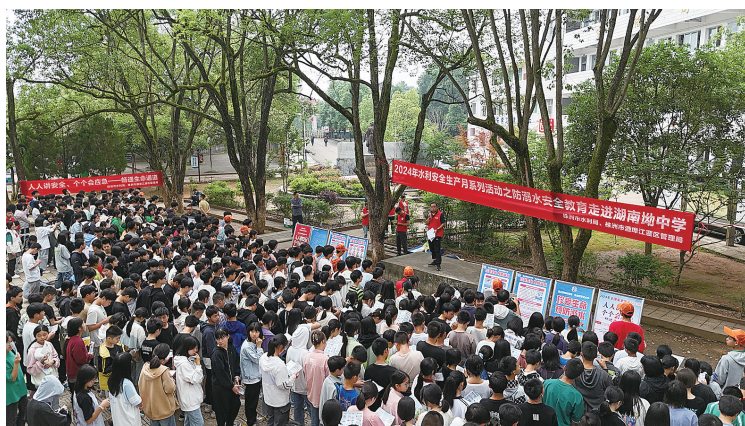
防溺水宣传引得学生围观。

株洲日报(全媒体记者/王军 通讯员/谭琦)天气转热,野外溺水事故进入易发、高发、频发阶段。6月6日,市水利局和酒埠江灌区管理局联合开展防溺水安全教育进校园活动,在攸县湖南中学、攸县网岭中学向学生们讲解了防溺水常识、溺水救援技能及急救知识,给学生打安全“预防针”。