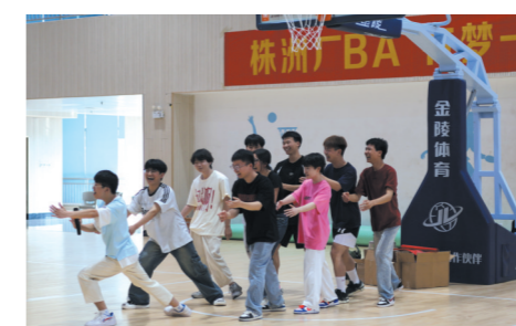
▲市三医院进校园开展考前减压团建活动。