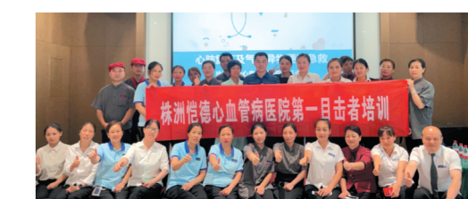
▲培训现场。

企业、学校、机关、社区等地，让学习急救知识与技能贴近百姓，让更多的人成为能救、会救的“第一目击者”，为建设健康中国、健康湖南、健康株洲积极贡献力量。