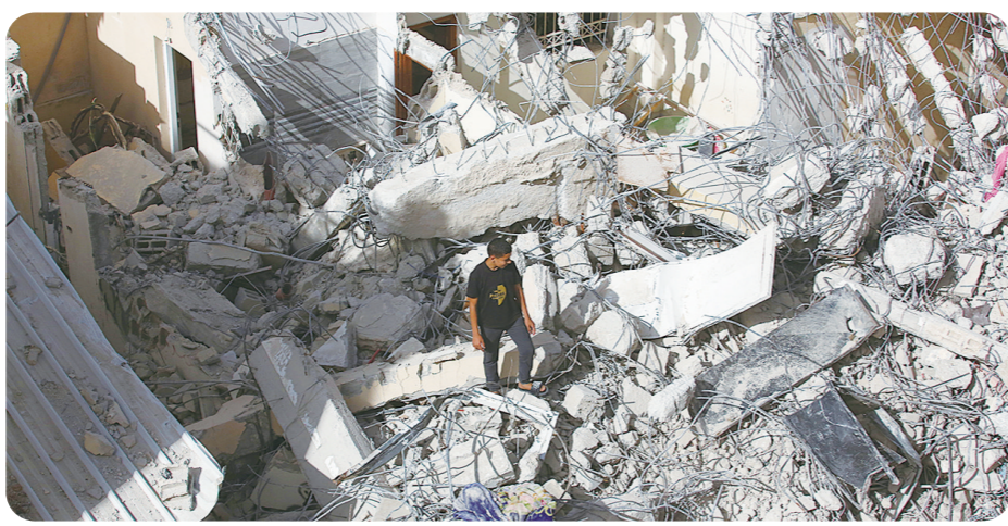
5月23日，在约旦河西岸城市杰宁，一名男子查看建筑受损情况。