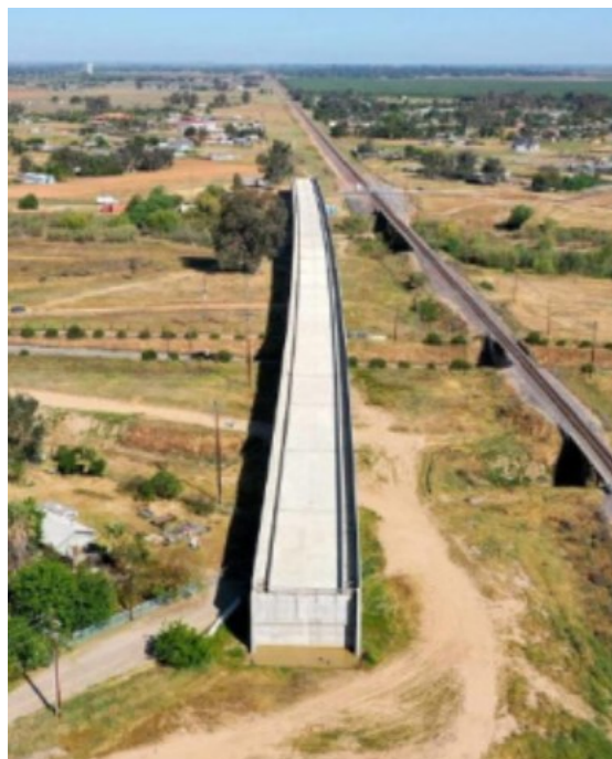
这座高铁桥位于加州马德拉县。

一直以来,美国都想修建连接旧金山到洛杉矶两大城市的加利福尼亚州高铁项目。按原计划,这将是美国首条高铁项目。