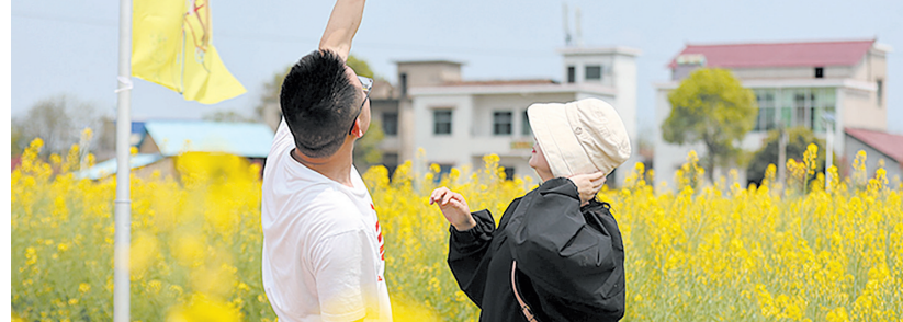
游客在挽洲岛赏花、放风筝。

挽洲岛是湘江流域的江心洲,长1.8公里,宽800米。因景色宜人、地域独特,曾亮相央视航拍中国栏目。相传公元769年,诗圣杜甫携眷行船至此,被这里的奇观异景所吸引,留下了《次晚洲》诗,流传至今。