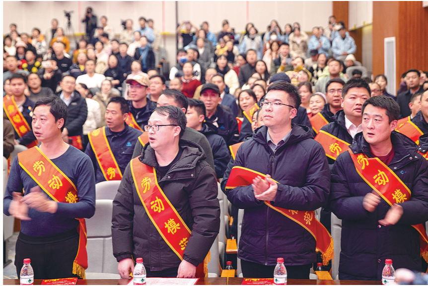
“礼赞劳模工匠”新春音乐会现场。

2月24日,元宵佳节,职工元宵游园会准时开启。活动现场,欢声笑语不断,DIY灯笼、锦鲤套圈、献瑞投壶、猜灯谜等趣味活动吸引了一波波职工参与。“和孩子一起制作灯笼,玩游戏闹元宵,沉浸式体验了传