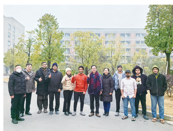
“祝同学们春节快乐!”2月9日,农历除夕,湖南汽车工程职业学院领导来到该院留学生公寓,看望寒假申请留校的留学生,和他们共同感受中国传统年味。