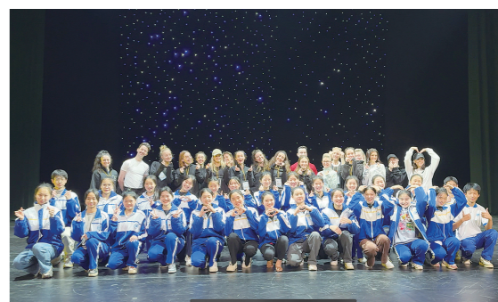
市四中学生与舞蹈大师同台。

株洲日报(全媒体记者/孙晓静 通讯员/白静)2月18日,在3名舞蹈老师的带领下,市四中教育集团的65名高中舞蹈专业学生和35名初中舞蹈专业学生,前往神农大剧院与爱尔兰舞蹈家们面对面进行交流,深入了解爱尔兰舞蹈《舞之魂》的台前幕后。