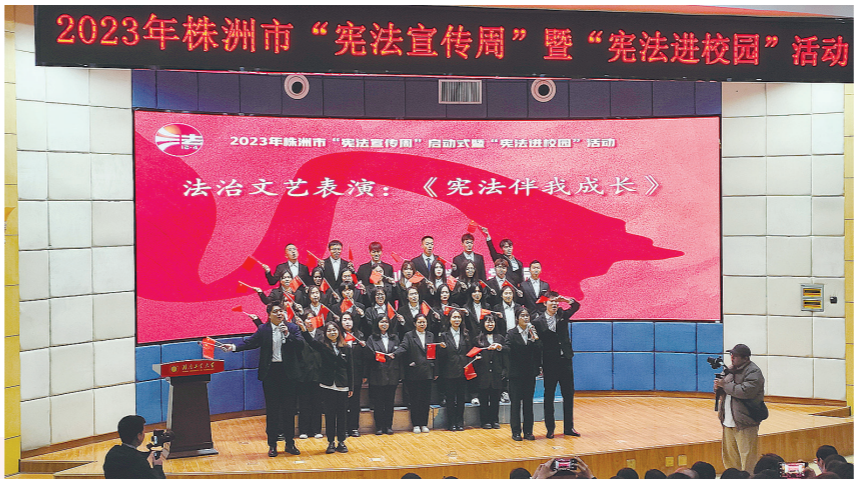
湖南工业大学法学院的大学生演唱《宪法伴我成长》宪法主题歌曲。

今年“宪法宣传周”期间,我市将紧紧围绕“大力弘扬宪法精神,建设社会主义法治文化”主题,集中开展“宪法九进”活动,即宪法进农村、进社区、进校园、进机关、进军营、进网络、进文旅游馆、进交通场所。同时结合12月的行政复议法学习宣传月活动,在市政府常务会议组织行政复议法专题讲座,进一步强化领导干部等重点人群学法用法。各县市区还将通过联播、联展、联动、三联并进,持续深入宣传宪法,营造浓厚法治氛围。