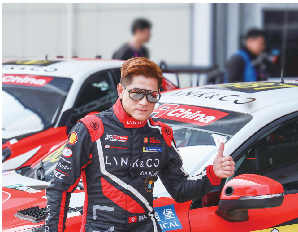
香港明星郭富城是赛事的焦点。