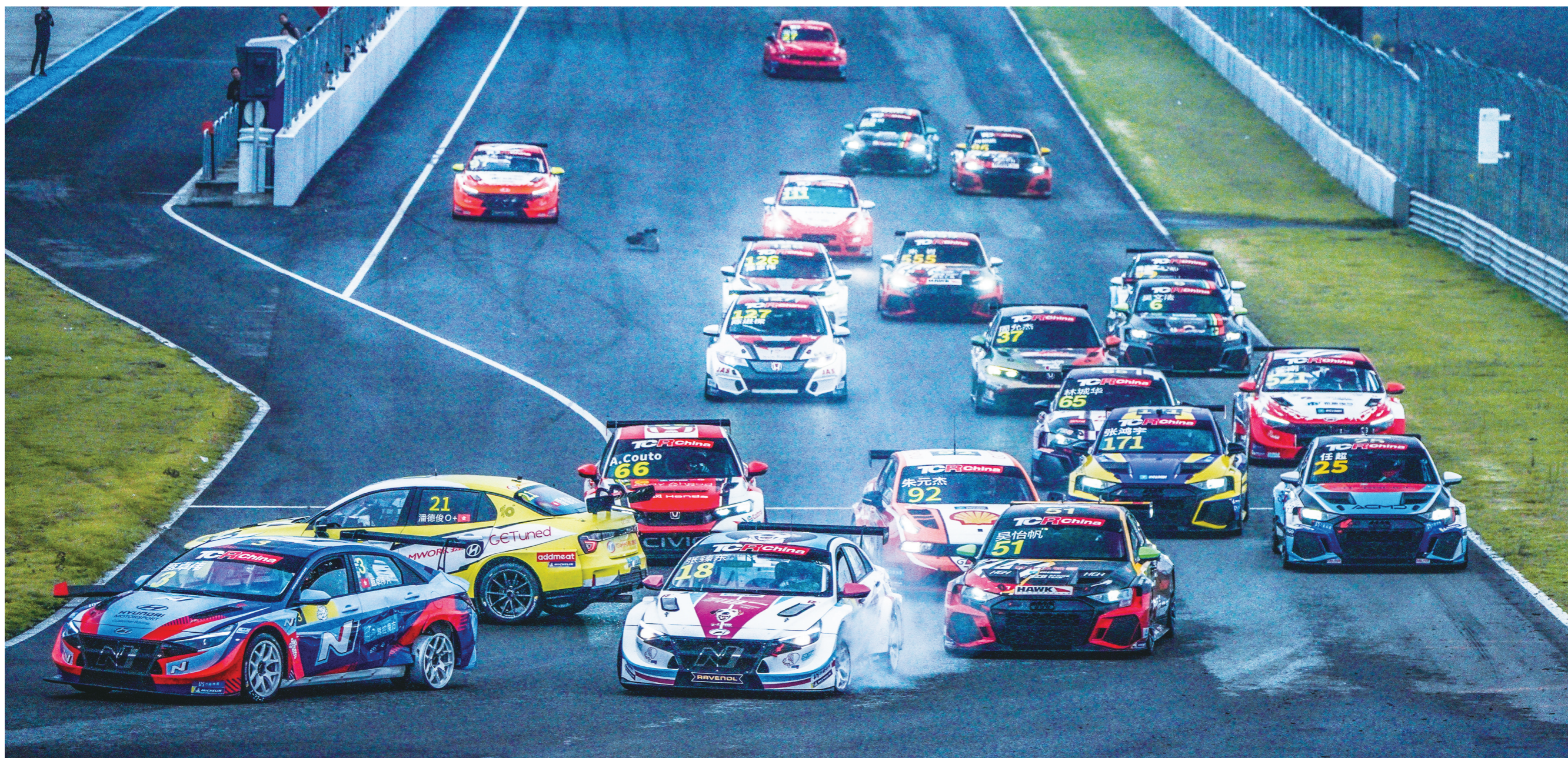
比赛开始,各赛车奋勇争先,互不相让。