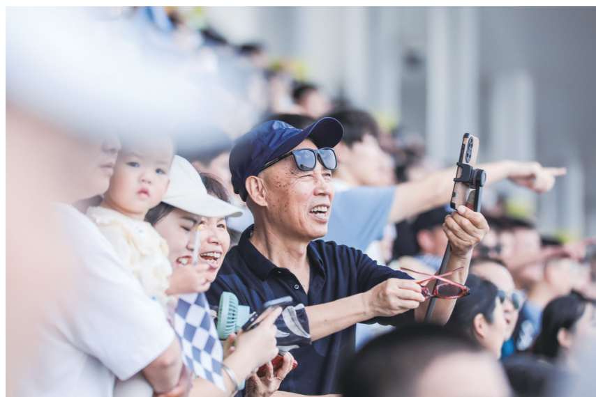
一位老人用手机拍摄精彩瞬间。