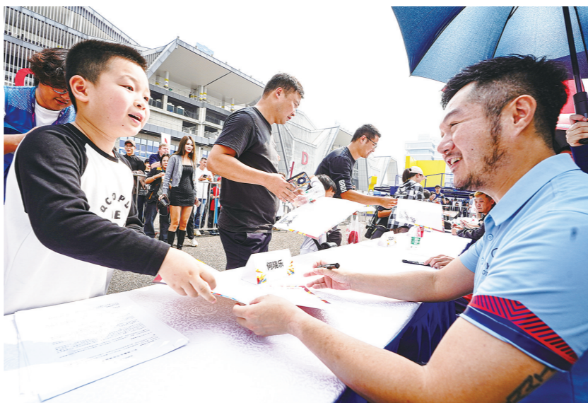
比赛前,车手为小观众签名留念。