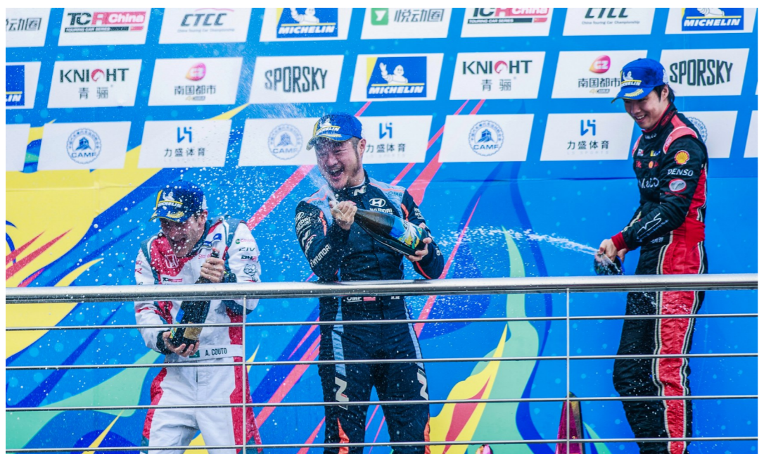
车手在领奖台上喷洒香槟,庆祝获胜。