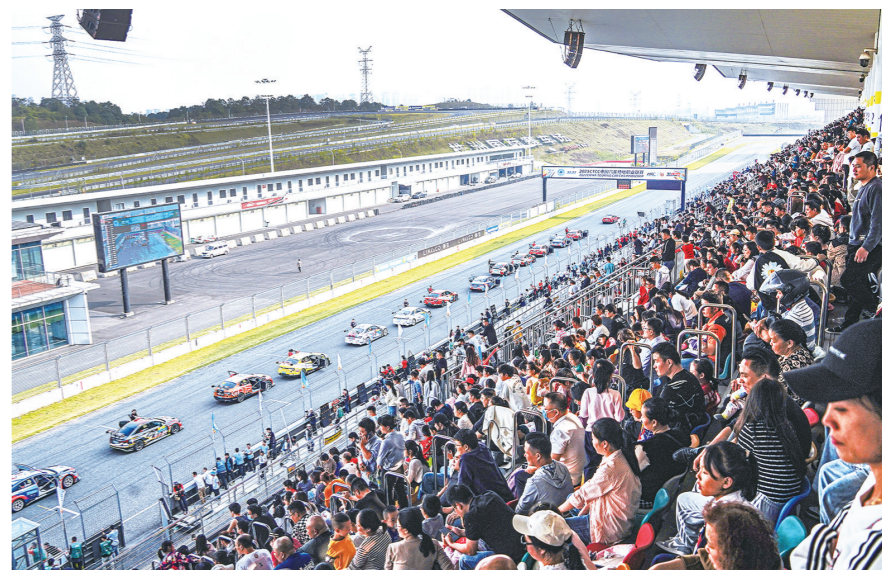
精彩的比赛吸引了诸多市民。