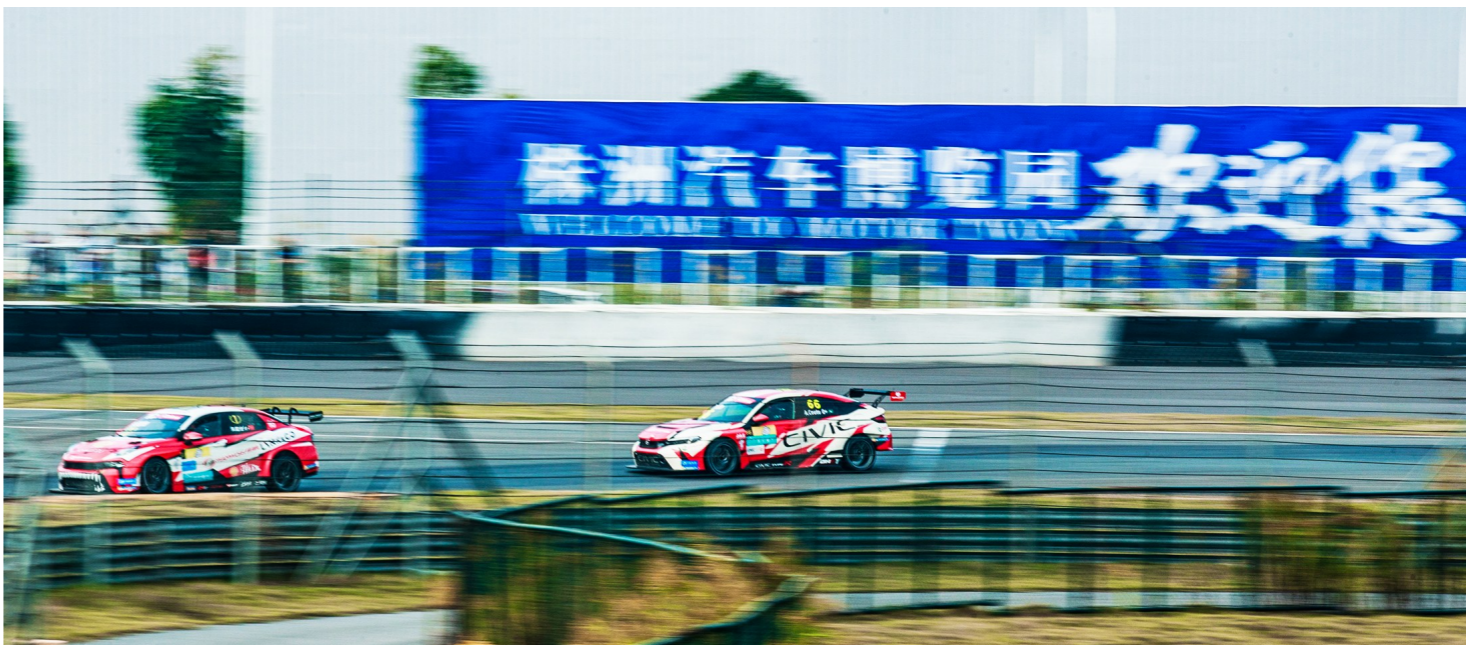
赛车在汽博园赛道上飞驰。