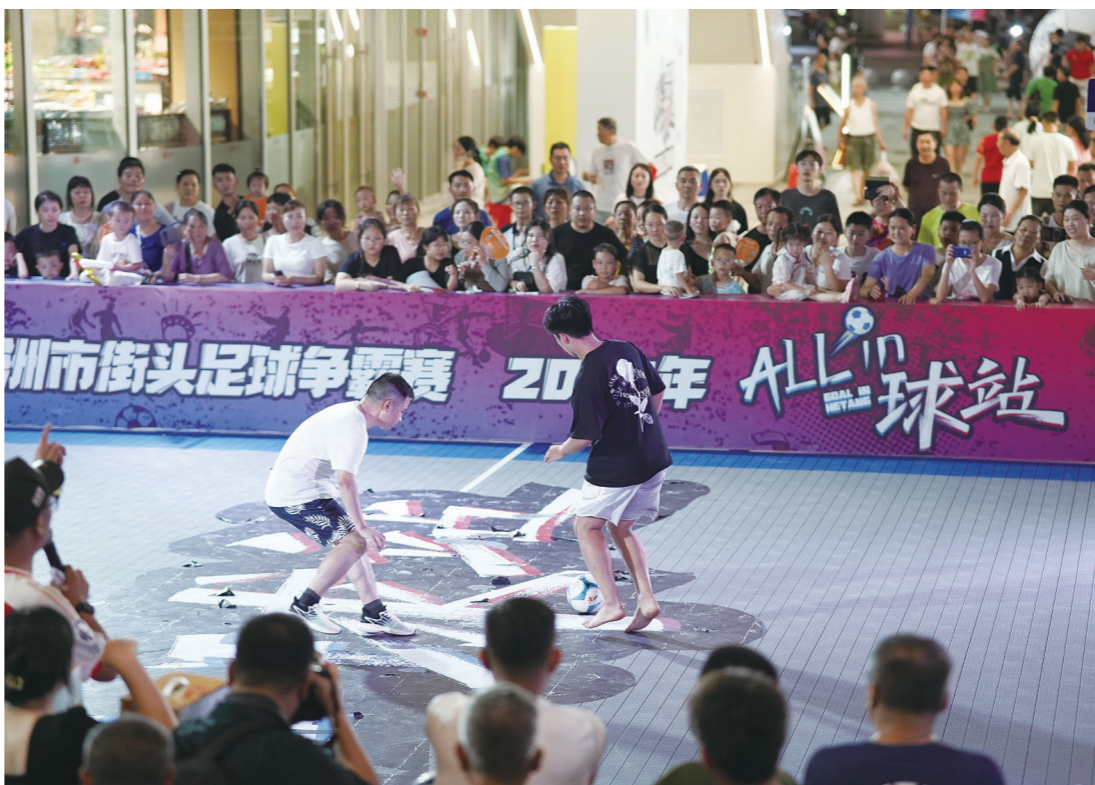
街头足球一对一争霸。