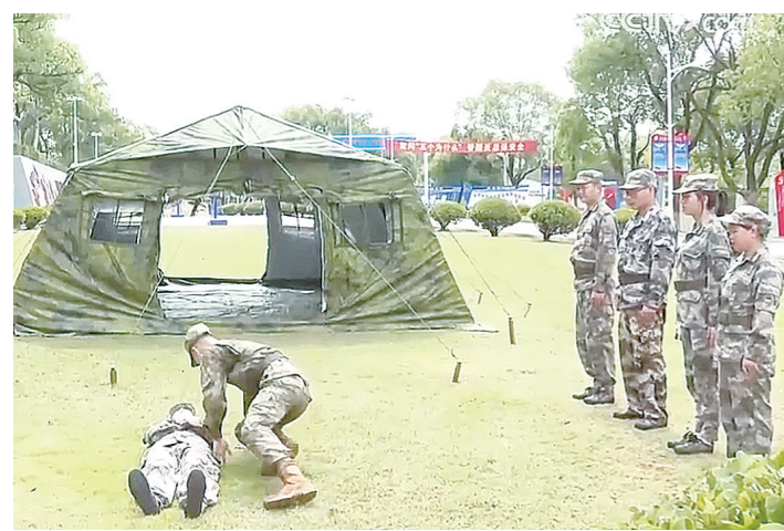
医疗救护集训现场。

株洲民兵联合空军部队组织开展医疗救护集训,提高自身的战场医疗救护和应急保障能力。 文字、图片、视频/央视网