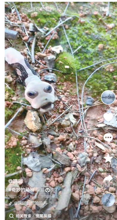
网友发现的宽尾凤蝶幼虫(网络截图)。

束,变成的蛹也十分神奇,无论从外观,还是触感,跟枯树枝没有二致,让它很难被天敌发现,最终破茧成蝶。