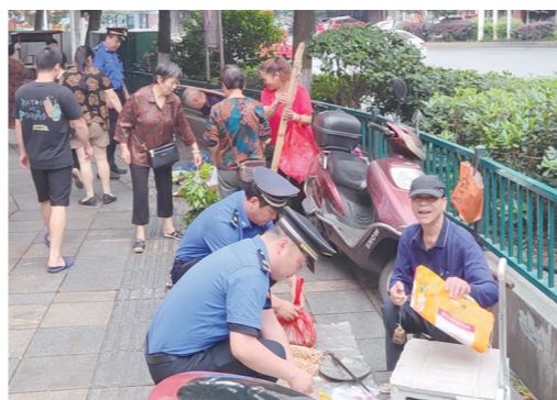
执法人员在帮占道经营的老人将蔬菜装入箱子内,引导他到农贸市场摆摊。

“面对柔性执法,我们内心更能接受,更能认识到,配合执法就是配合创建文明城市。”一名店主说。此次行动,执法人员共劝导门店出店经营、乱