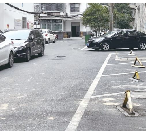
水机小区,地锁占用停车位,部分车辆占道停放,加剧小区拥堵。

5月31日,本记者发现,该小区消防通道一侧,施划有一排公共停车位,数量有数十个。很多停车位内,立着地锁,无车辆停放。不少车辆停放在通道区域。