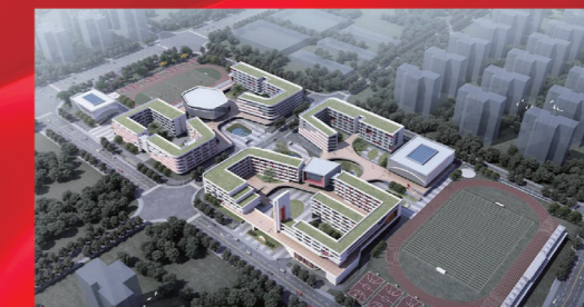
▲长沙市一中城南中学效果图