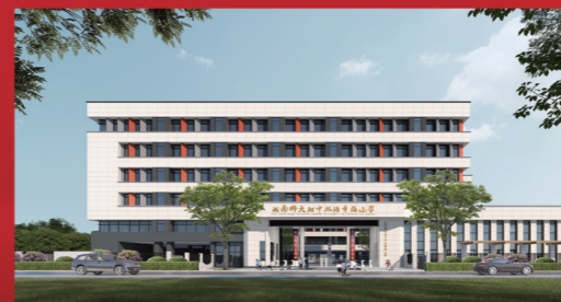
▲湖南师大附中双语幸福小学效果图