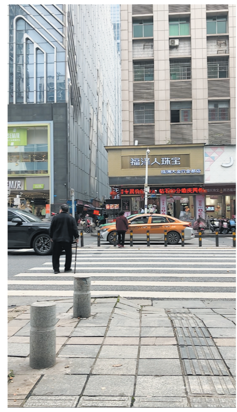
▶3月28日上午,建设南路,车辆未礼让拄拐过马路的老人。

记者手记 莫抢那丁点时间 记者蹲守的河东老城区与河西较早开发区域路段,均处于老旧小区周边,是老年居民出行集中地。斑马线上车辆是否礼让,直接影响着他们的出行安全。 这些老人和我们一样年轻过,为这座城市作出了巨大贡献,创造了一个又一个奇迹。他们也曾是城市文明和谐秩序的奠基者,全国文明城市的金字招牌也有他们的功劳。还有不少老人是“文明使者”,至今仍以志愿者身份发挥余热,活跃在城市的各个角落,为你服务。 因此,面对斑马线上的老人,踩一脚刹车,减速让行,是对他们最基本的关怀,也能体现必要的敬意。“老吾老以及人之老”,当你面对斑马线上的自己的父母,甚至当自己老去蹒跚独行马路时,你是否也会踩下油门飞驰而过? 老人行动再慢,过马路也不过两三分钟,我们再着急,也不差这一点时间。请驾驶员们在斑马线前,不要和老人抢那丁点的时间,踩一脚刹车。