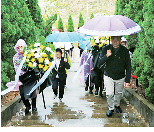
4月4日,株洲高新区动力谷双创中心党委,带领园区株洲湘火炬汽车灯具有限责任公司等多家企业党支部,联合湖南理工职业技术学院动力谷分院党支部,赴罗哲烈士墓开展清明节追思先烈共建主题党日活动。

上午9时,一行人冒着大雨迈着沉重的步伐抵达罗哲烈士墓,动力谷分院学生志愿者对罗哲烈士的英雄事迹进行了讲解,全体党员在烈士墓前庄严肃立、默哀,表达对烈士的缅怀和敬仰之情。