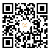
直击斑马线不礼让老人现象,手机扫描二维码可观看相关视频。

记者手记 莫抢那丁点时间 记者蹲守的河东老城区与河西较早开发区域路段,均处于老旧小区周边,是老年居民出行集中地。斑马线上车辆是否礼让,直接影响着他们的出行安全。 这些老人和我们一样年轻过,为这座城市作出了巨大贡献,创造了一个又一个奇迹。他们也曾是城市文明和谐秩序的奠基者,全国文明城市的金字招牌也有他们的功劳。还有不少老人是“文明使者”,至今仍以志愿者身份发挥余热,活跃在城市的各个角落,为你服务。 因此,面对斑马线上的老人,踩一脚刹车,减速让行,是对他们最基本的关怀,也能体现必要的敬意。“老吾老以及人之老”,当你面对斑马线上的自己的父母,甚至当自己老去蹒跚独行马路时,你是否也会踩下油门飞驰而过? 老人行动再慢,过马路也不过两三分钟,我们再着急,也不差这一点时间。请驾驶员们在斑马线前,不要和老人抢那丁点的时间,踩一脚刹车。