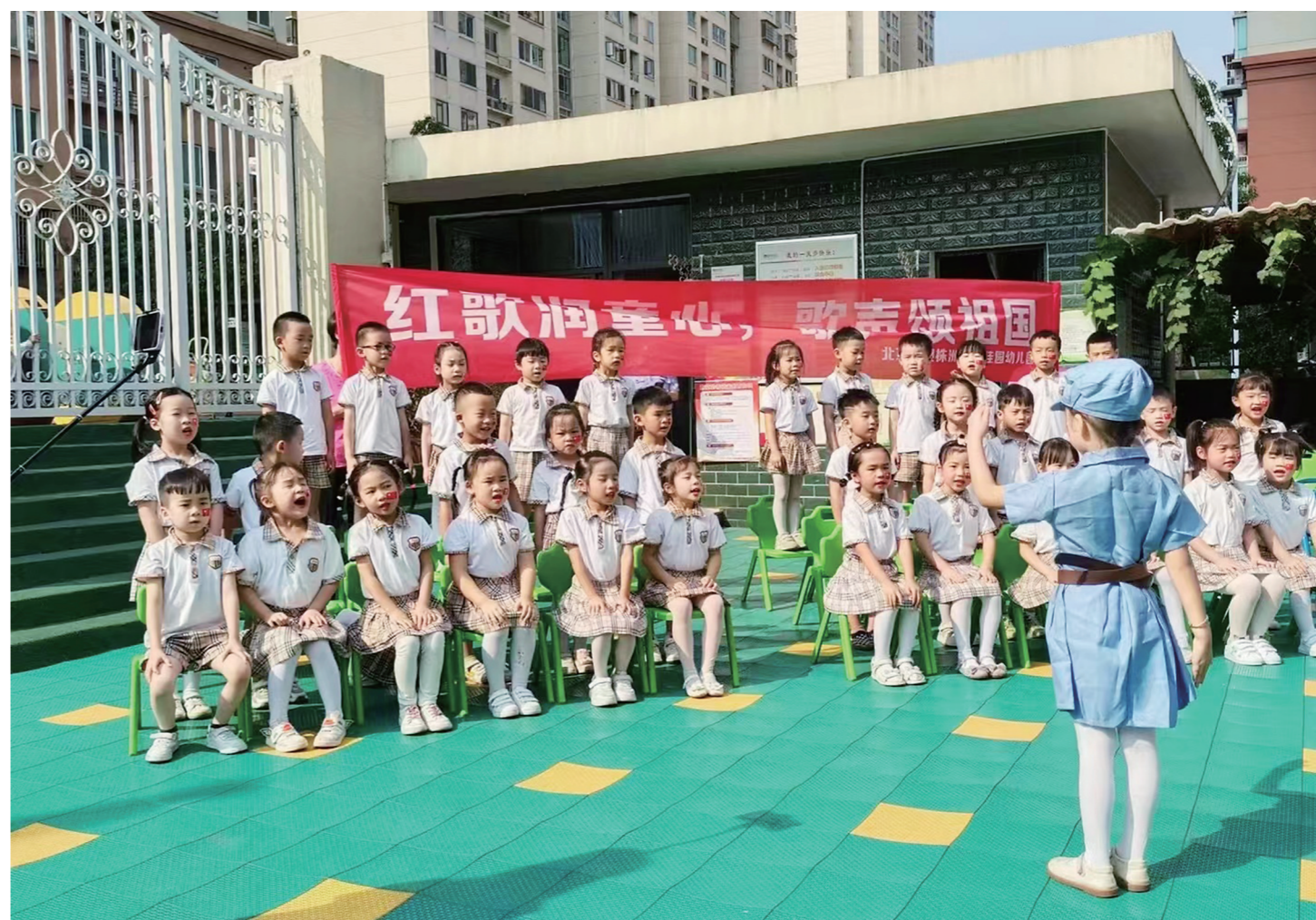
▲昨日,北京红缨株洲康馨幼儿园举行主题为“红歌润童心,歌声颂祖国”庆祝国庆活动,通过讲述红色故事、唱红歌、组织红色游戏等活动,寓教于乐地培养幼儿爱党、爱国、爱军情感,为迎接党的二十大营造浓厚氛围。