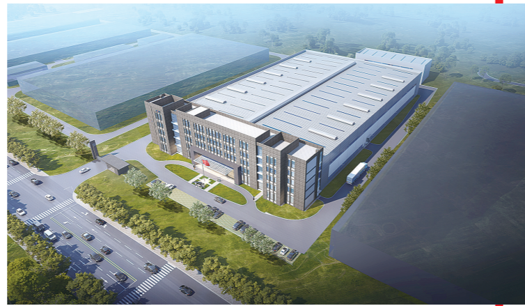
博鲁斯潘精密机床一期项目投产后,将实现高端数控机床的国产化替代。