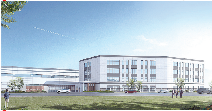
宏工智能自动化装备项目一期部分厂房将于9月底交付。