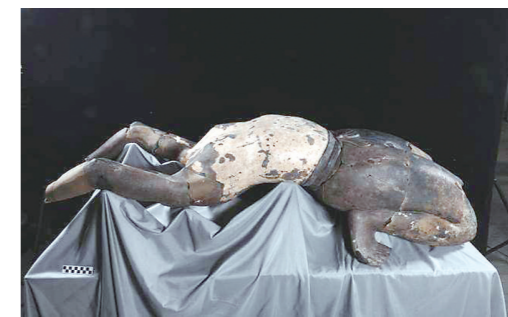
▲这是经过保护修复的“仰卧俑”。

“仰卧俑”出土于秦始皇帝陵K9901陪葬坑,这座陪葬坑因出土了几十件姿态为百戏表演的陶俑,而被称为“百戏俑坑”。“仰卧俑”被发现时残破非常严重,由数十块残片组成,头部及