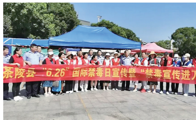
▲茶陵县举行集中宣传活动。

本报讯(株洲晚报融媒体记者/沈全华 通讯员/谢欣)6月26日是第35个国际禁毒日,6月成为“全民禁毒宣传月”。连日来,在市县两级禁毒办的牵头组织下,各地禁毒委成员单位纷纷开展2022年“禁毒宣传进万家”暨“防范新型毒品危害”宣传活动,从线上线下两端发力营造全民参与禁毒的浓厚氛围。