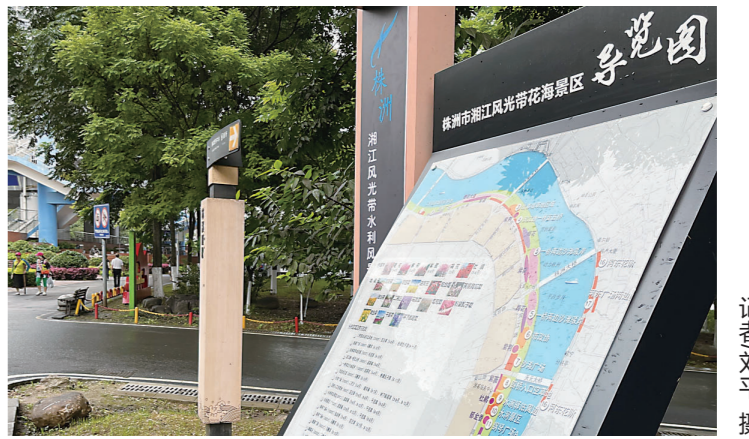
▲湘江风光带花海景区导览图。

本报讯(株洲晚报融媒体中心/刘平)6月22日,有市民在天元大桥附近的河西湘江风光带散步时发现,游道边新安装了“株洲市湘江风光带花海景区导览图”展示牌。