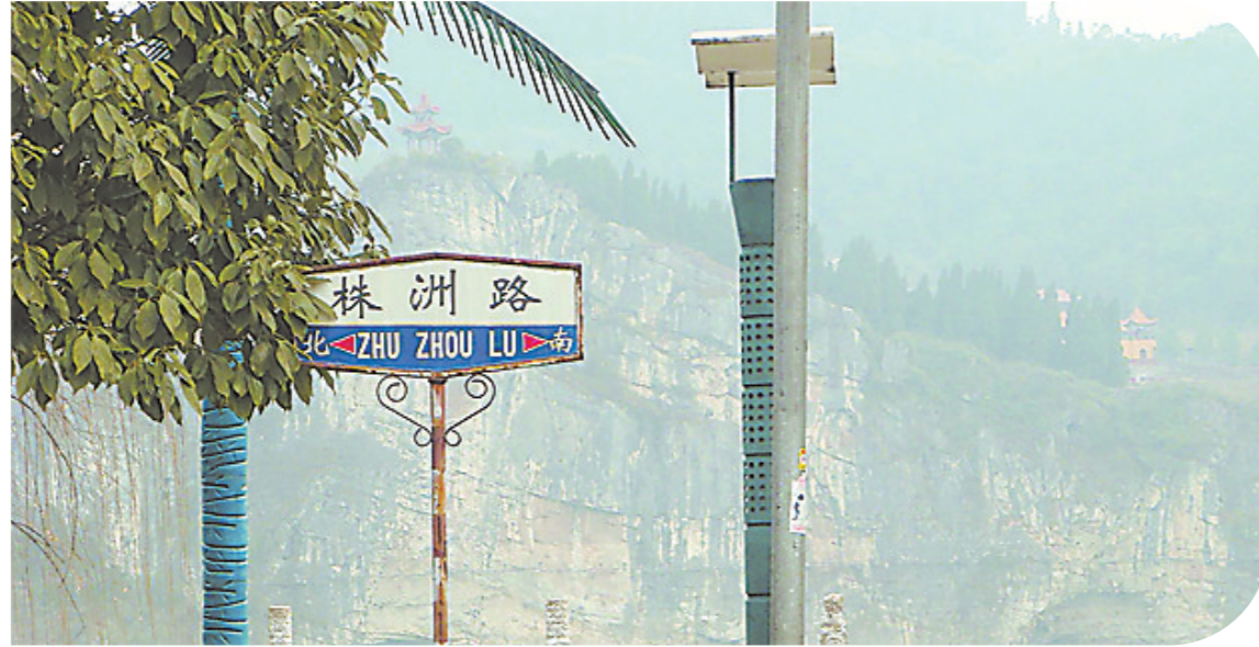
▲泸溪县的株洲路(资料图)

相较之下,商丘市、乌鲁木齐市、株洲路,生活气息更浓。其中,商丘的株洲路位于梁园区,全长约为1.7公里;乌鲁木齐市的株洲路周边商铺和小区林立,距离乌鲁木齐市植物园约为2公里。