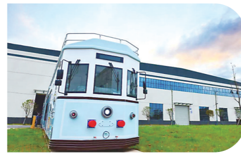
▲“株洲造”即将出口海外的双层旅游小货车。