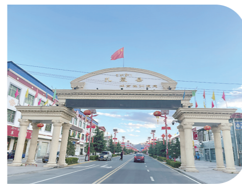
▲株洲路,见证我市与扎囊县的特殊情缘。