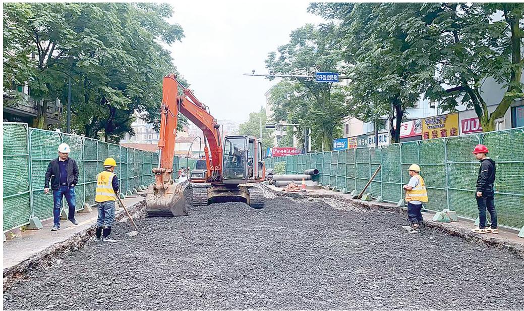
田心路施工现场,株洲日报全媒体记者/吴楚 摄