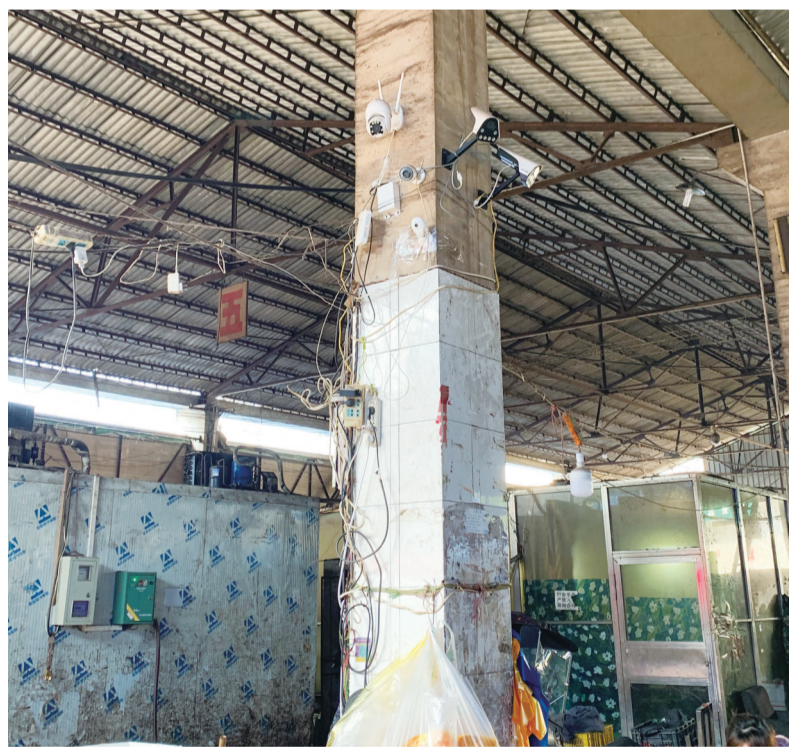
市场内一角电线纠缠

把本土一批市场萎缩怪罪于巨头抢滩,未免太狭隘。从市内来看,金世纪、东大门批发市场先后起势并形