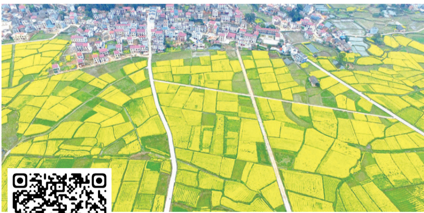
茶陵秩堂油菜花(资料图)。

春天在哪里,在层层叠叠的油菜花里!茶陵素有种植油菜传统习惯,油菜面积占到耕地的四成,达到22万亩,菜籽油产量2.5万吨,拥有10个万亩油菜大镇。