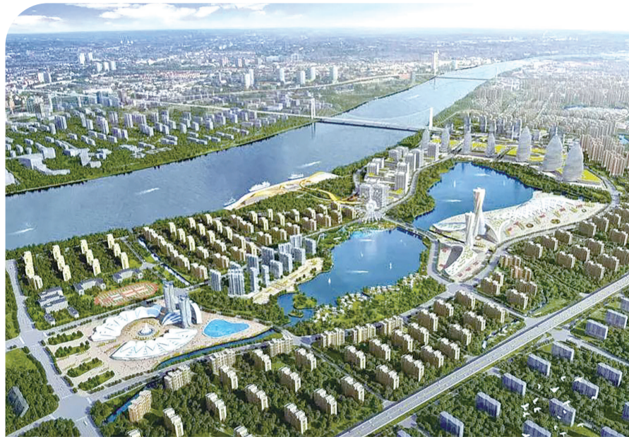
湘江新城规划效果图。