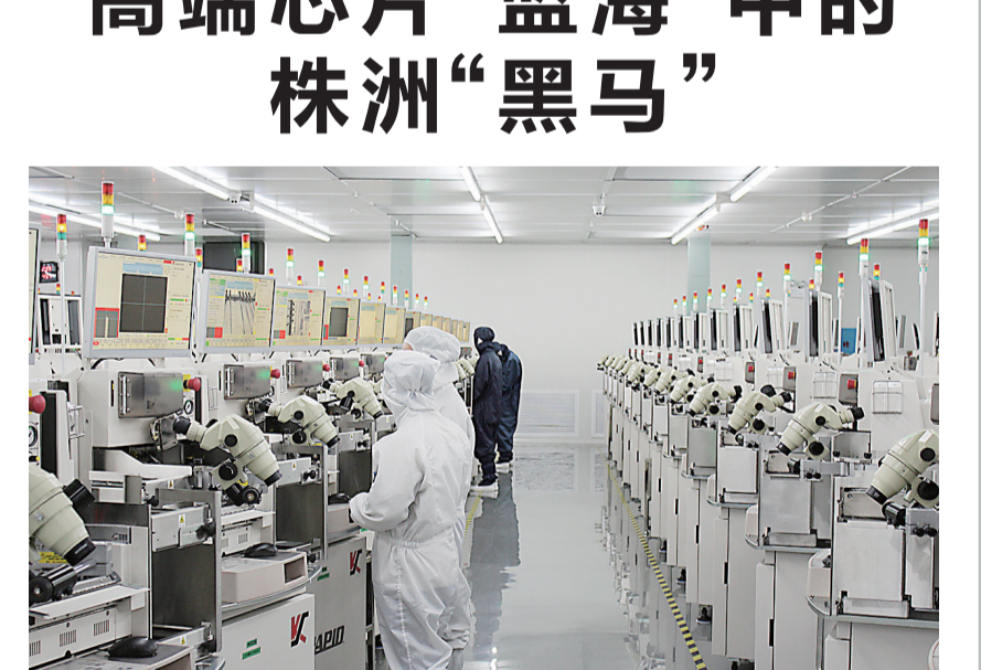
株洲越摩技术人员正在对高性能芯片进行封装。