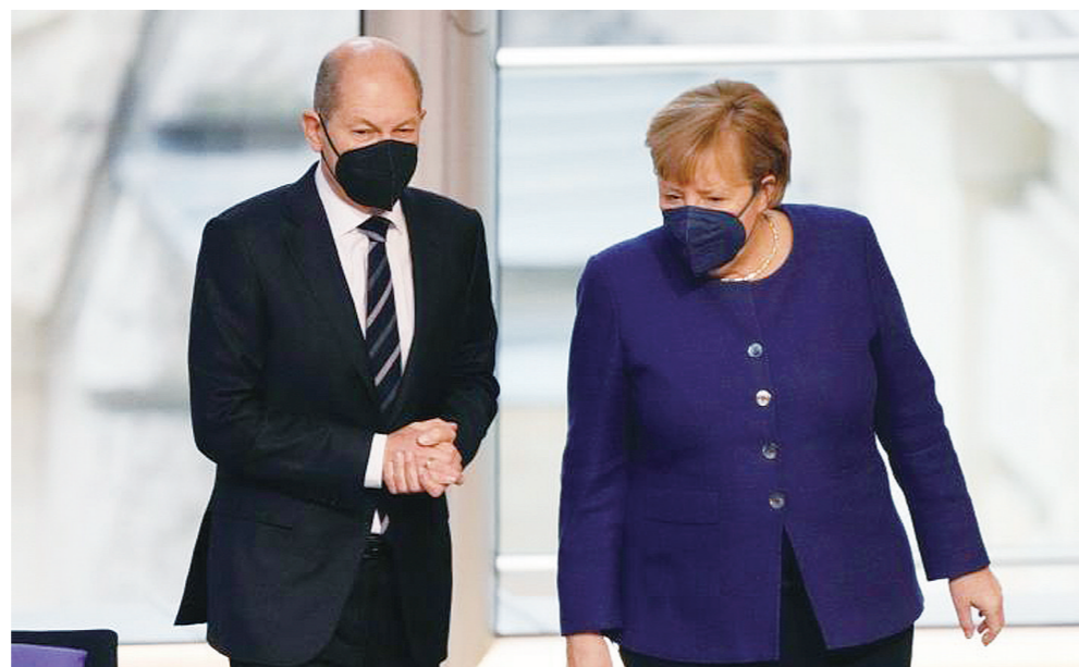
▲朔尔茨(左)和默克尔。(资料图)

德国社会民主党(社民党)、绿党和自由民主党(自民党)7日在柏林正式签署联合组阁协议。新一届德国政府诞生,意味着长达16年的默克尔时代正式落幕。分析人士指出,如何带领德国解决面临的诸多挑战,考验新政府内部各方的政治智慧。