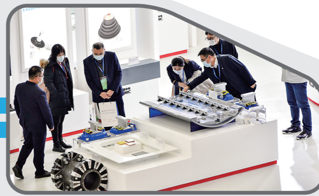
▲各类新材料和部件吸引眼球。