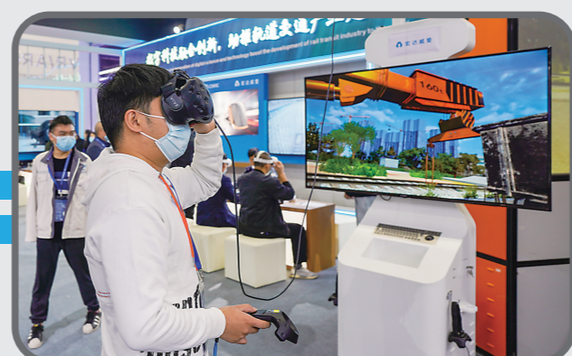
▲观众使用VR进行各类工程操作。