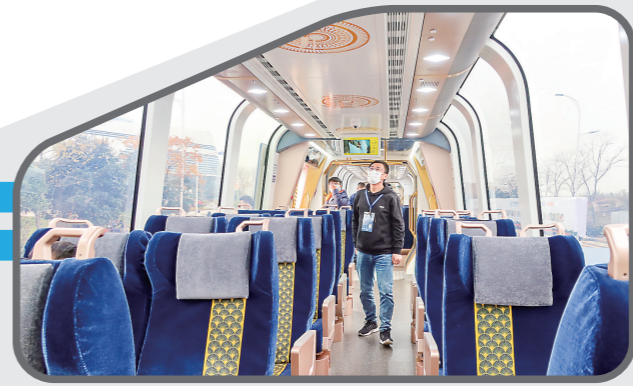
▲全球首列全景观光山地旅游列车内景。