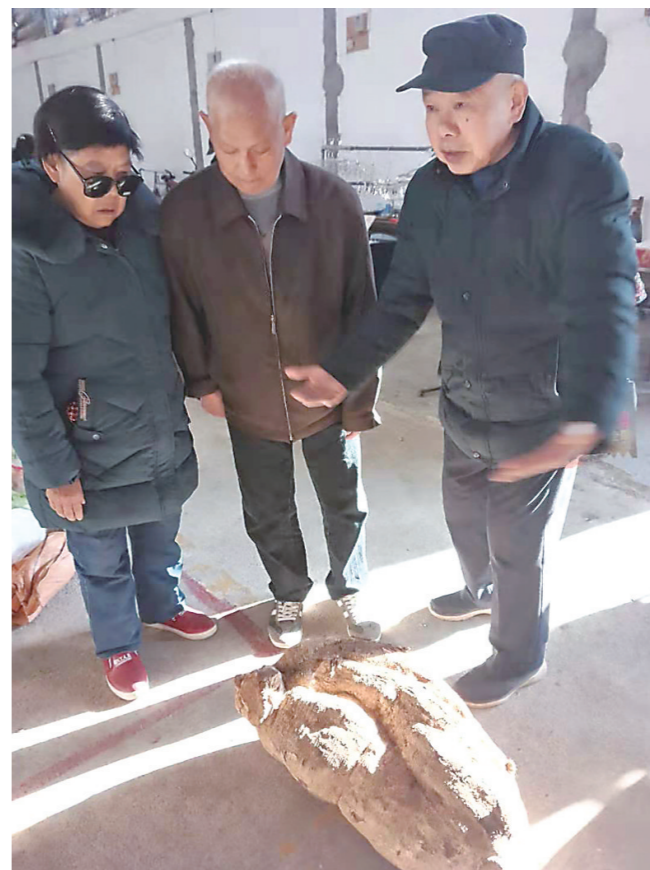
▲“这么大!”有人试着抱起葛根,就是抱不起来。

本报讯(株洲晚报融媒体中心记者/王鸿通讯员/张吉春)昨日上午,一条重达83斤的葛根一摆上芦淞区七斗冲农贸市场,就引来了大家的围观和议论。