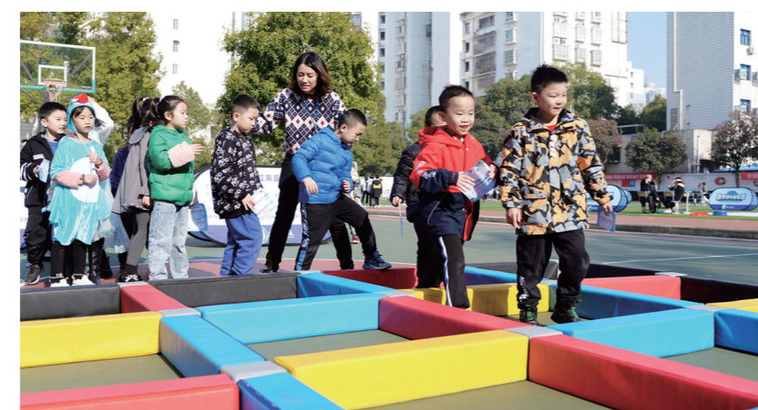
▲孩子们穿越红黄蓝迷宮。

本报讯(株洲晚报融媒体中心记者/戴凇 通讯员/邓孟晶)堆高游戏、红黄蓝迷宮、数字迷、计算迷宮……12月7日,天元区白鹤小学“数学嘉年华,快乐嗨翻天”活动拉开帷幕。活动根据不同年级,精心设计了近五十个数学游戏项目,孩子们游戏中学习,玩得不亦乐乎。 瞧!“数独”小达人潜心揣摩着,每个方格填写的数字都需要严密推理、认真推敲。而在计算迷宮中,考验的不只是孩子的判断力,还有速算能力。褪去数学神秘严肃的面纱,同学们走出课堂,走进游戏,学习用数学的眼光观察世界、用缜密的思维思考生活、用严谨的语言表达自我。 而在跳蚤市场活动中,中高年级的孩子化身小老板,将家中的旧书或旧玩具拿到学校里进行摆摊出售,让孩子在游戏中快速