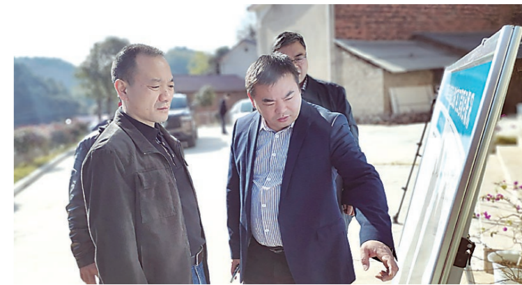
▲工作人员在项目现场进行调度。通讯员供图

本报讯(株洲晚报融媒体记者/周高 通讯员/肖海波 何海春)12月2日上午,涑口区南洲镇田家湾村G60醴陵高速公路扩容工程项目现场,施工人员正在加紧进行路基工程施工。“涑口区段的提前交地,为项目进场施工奠定了良好基础,也保证了建设进度。”项目业主单位负责人介绍,征拆工作的顺利进行,为项目提供了重要要素保障。