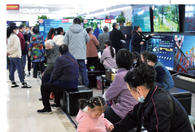
▲消费者三五成群地前往株百家电中心店选购产品

升级方面,株百家电携手各大主流家电品牌,用产品结构提升和跨品类突破,全面满足消费者一站购齐的消费体验;在场景升级方面,株百家电打造德国品牌西门子“智慧厨房”体验馆、海尔卡萨帝“家庭洗护中心”等,打破传统的单一产品摆放售卖属性,让到店用户沉浸式体验产品,在有限的门店空间基础上无限拓展线上场景,加强用户单品使用感知的同时激发套购需求。在服务升级方面,市内六小时送货到家等多样化的产品及品质化的服务,为门店售卖赋能提效,也带给消费者切实的售后保障。此外,12月2日-5日,开业期间,消费者预存20元购机抵50元-1000元;单件有礼,套购满额最高送1000元株百卡;农行信用卡支付还可满减百,最高减三百等系列掀起一场购物狂欢,开业钜惠,株百家电中心店、天元店、涑口店三店同庆! (文/白天天)