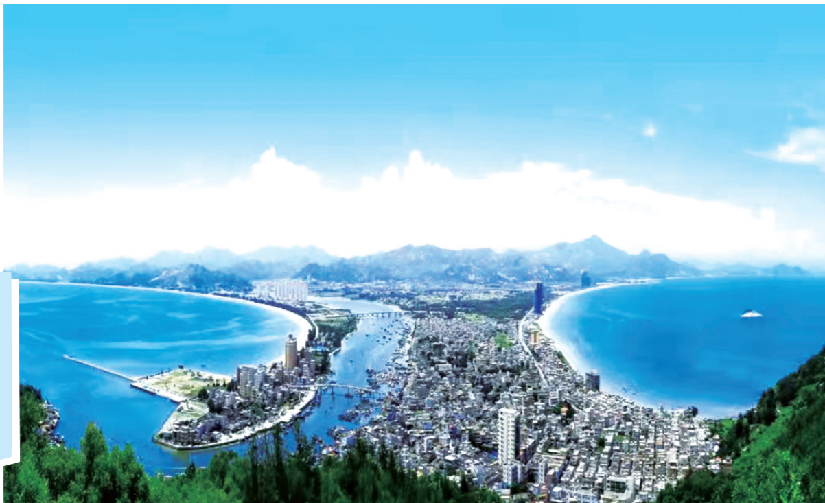
▲双月湾海滨风景区

如果有一种可能,生活在别处,面朝大海,从明天起做一对幸福的人,和老伴一起去异乡看看,诗人笔下的生活并不遥远,大海是人类的故乡,让心灵来趟旅行,沿着大海一点一点前往,去呼吸,去倾听,去观赏,我们这就走起吧!