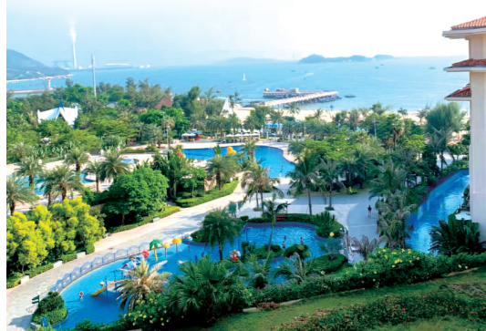
▲巽寮湾海滨风景区

巽寮湾位于惠东县城平山镇南部,地处北回归线以南,南海大亚湾的东部,依山傍海,山海相嵌,海天交融;属亚热带温湿型海洋气候,年平均气温21.7℃,总面积105平方公里。区内拥有得天独厚的滨海旅游资源,总长20多公里的海岸线内,有八个海湾,以石奇美、水奇清、沙奇白著称,被誉为“绿色翡翠”和“天赐白金堤”。巽寮湾的山、海滩、海岛巨石遍布,海湾一带有摩崖石刻30多处,海面隐隐约约分布着大大小小数十个洲。巽寮湾后三角岛是由三座相连的小山组成小岛,岛上泉水清澈,沙质柔软,峰奇石怪。