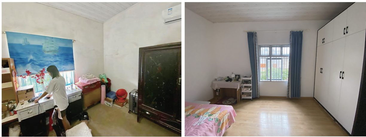
▲天元区“团团希望小屋”改造前后对比。

崭新的书桌,白色的墙面,宽敞的床铺,莫兰迪色的窗帘垂到地面……阳光透过窗户照进焕然一新的房间,家住天元区栗雨社区的小秋(化名),站在新房间里,笑容如同阳光一样灿烂。而之前,这个房间破旧不堪,没有像样的家具,而且是多人同住。