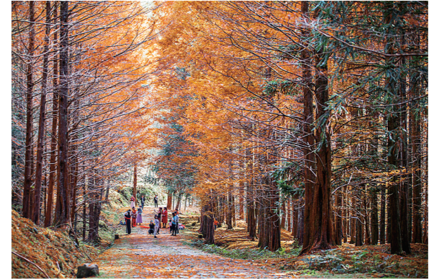
炎陵县磁石林场。