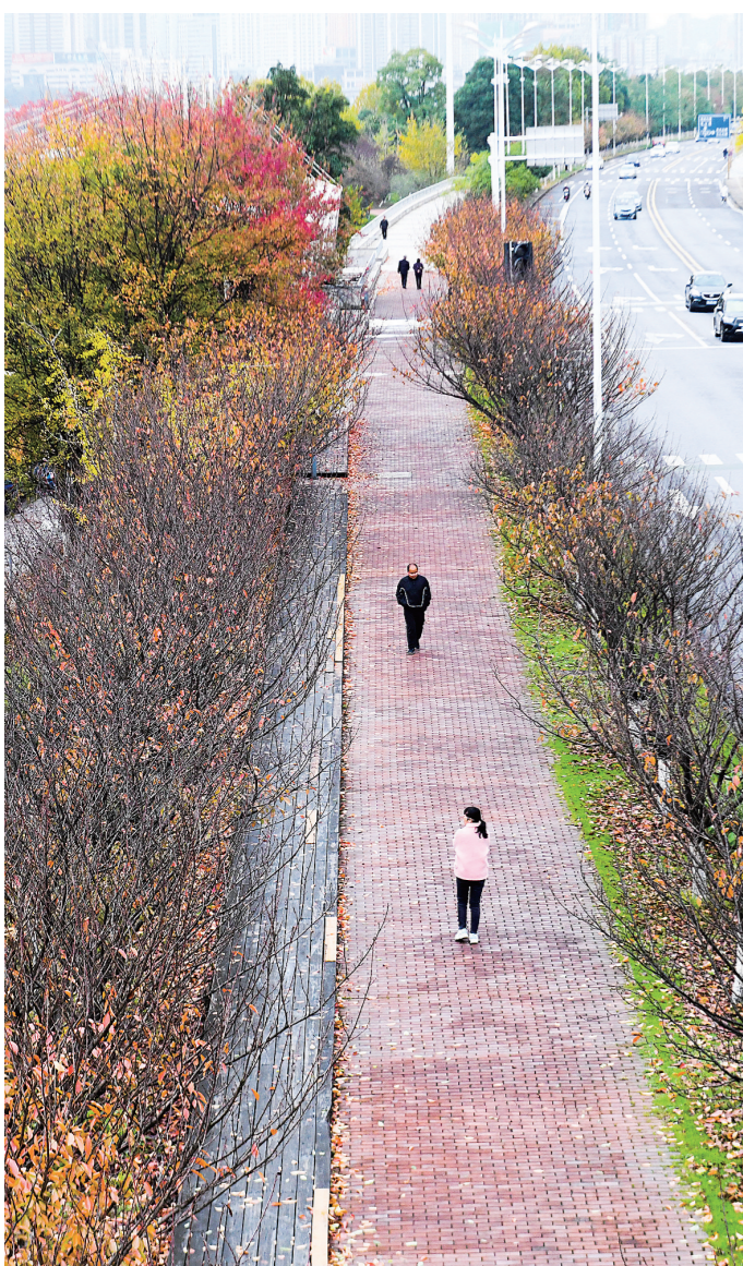
风光带的五彩步道。