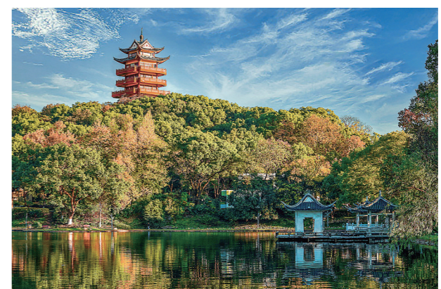
攸县攸州公园。