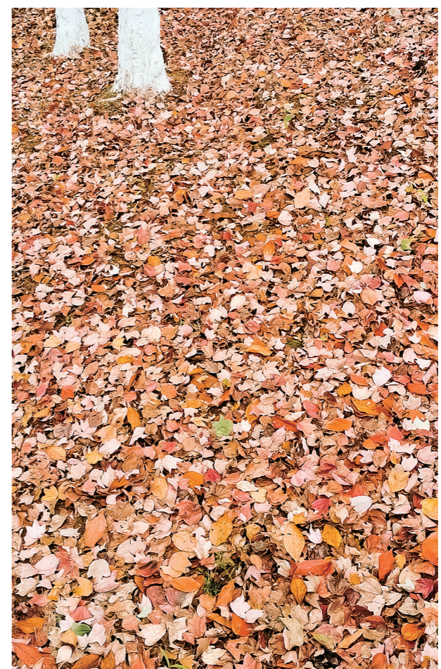
石峰公园的五彩落叶。