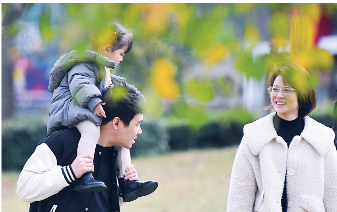
好天气,带着孩子来到神农城休闲。

初冬的色彩 文/张威 株洲的初冬时节,空气明净。石峰公园里红叶染树、黄叶铺地,色彩斑斓,相映成趣,宛若披上了一条绚丽多彩的绸缎,美不胜收。在庐山路和钻石路,满目金黄,银杏叶一簇簇,在暖阳下格外绚烂耀眼。在沿江风光带,层林尽染,景美如画,市民们纷纷拿出手机拍照留念,打卡游玩。从空中俯瞰神农公园,苍翠林木间,红的、黄的、橙的……尽展大自然绚烂之美。 近年来,我市大力打造绿色宜居城市,以花为媒,遍植花草苗木,新建小游园、改扩建各大城市公园。推窗见绿、出门即景,匠心独运把绿植花木巧妙地融合进城市的每一条街区、每一个角落。城市中,环境、人文与历史底蕴和谐共生、相辅相成,共同奏响生态宜居的进行曲,为这座美丽城市注入新活力,赋予新生机。