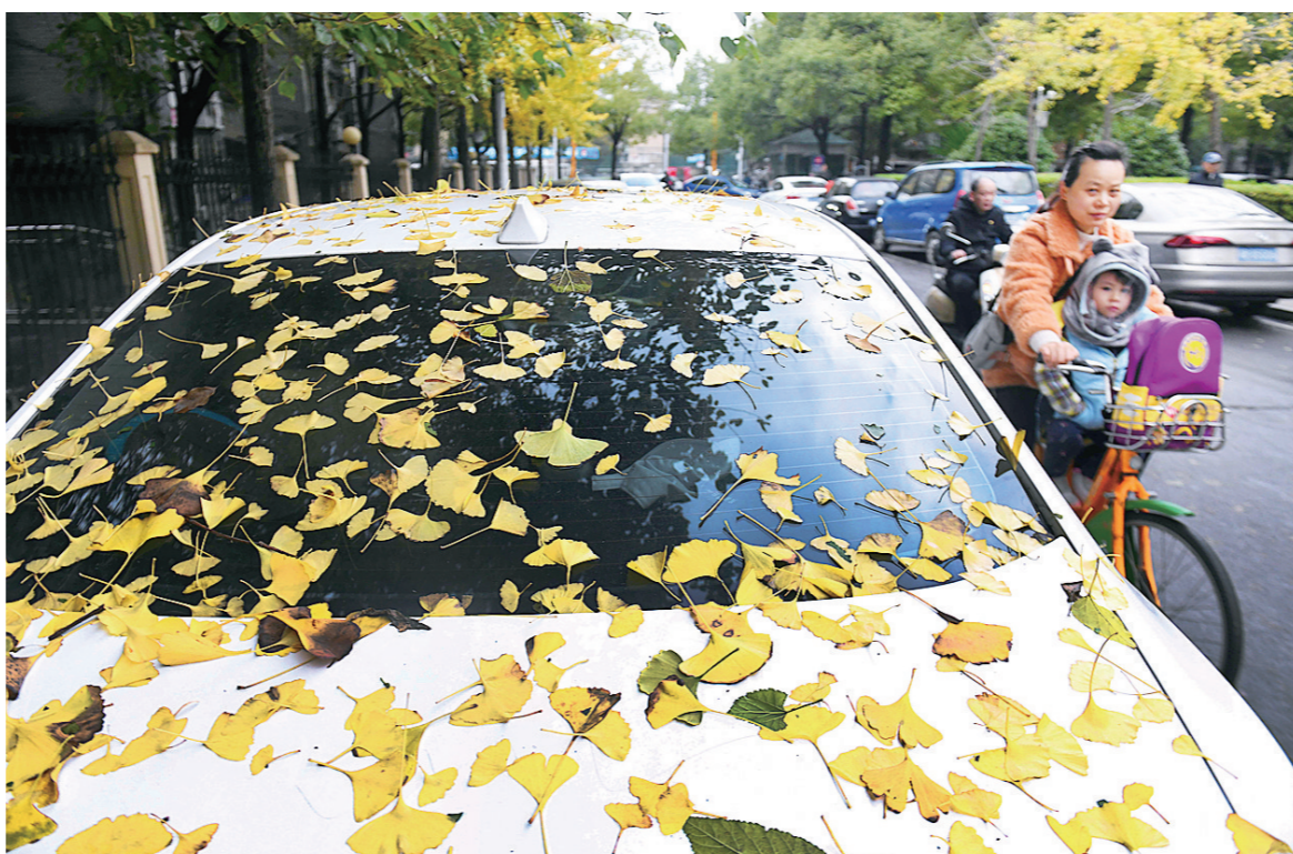
钻石路,飘落在车上的银杏叶成了一处独特的景色。