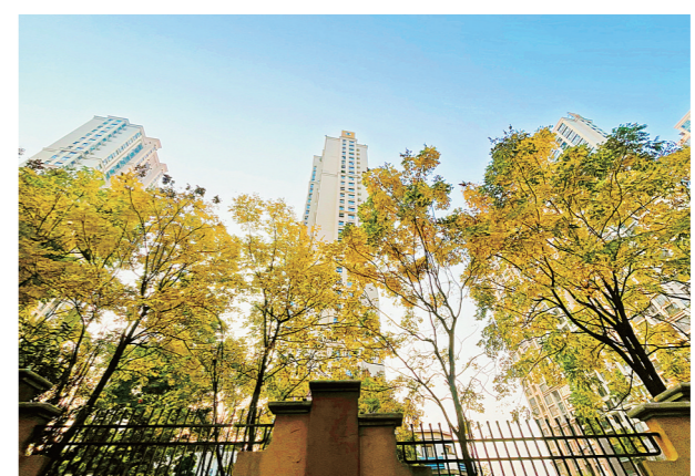
佳兆业小区的金色树叶。