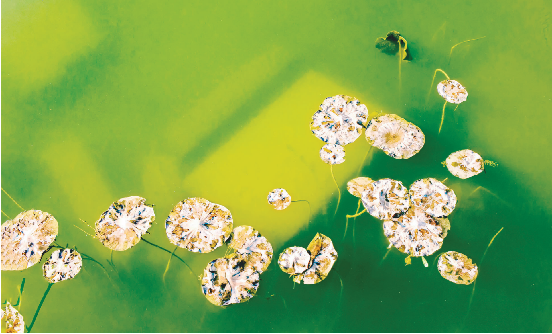
初冬,仙霞岭池塘中的残荷。

·中国教育工会株洲市委员会遗失 12430200738996975K 号事业单位法人证 正、副本